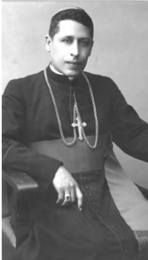
Víctor Manuel Sanabria, el prelado costarricense más comprometido con la reforma social; cerca de 1940 (cortesía del Archivo Nacional de Costa Rica).

El contenido de los textos precedentes evidencia cómo el discurso eclesiástico y el de los comunistas poco a poco, empezaron a converger, proceso facilitado por el giro “izquierdista” que experimentó el enfoque clerical y porque el BOC, a medida que consolidaba su inserción política, abandonaba su “ultraizquierdismo” inicial y, a tono con el cambio experimentado por el Comintern a partir de 1935 (Caballero, 1986: 122-123; Fornet-Betancourt, 2001: 172-173), asumía una estrategia de tipo frente popular (Cerdas, 1986: 307-344; Merino del Río, 1996: 27-69). La confluencia en el centro fue viable por la existencia de un