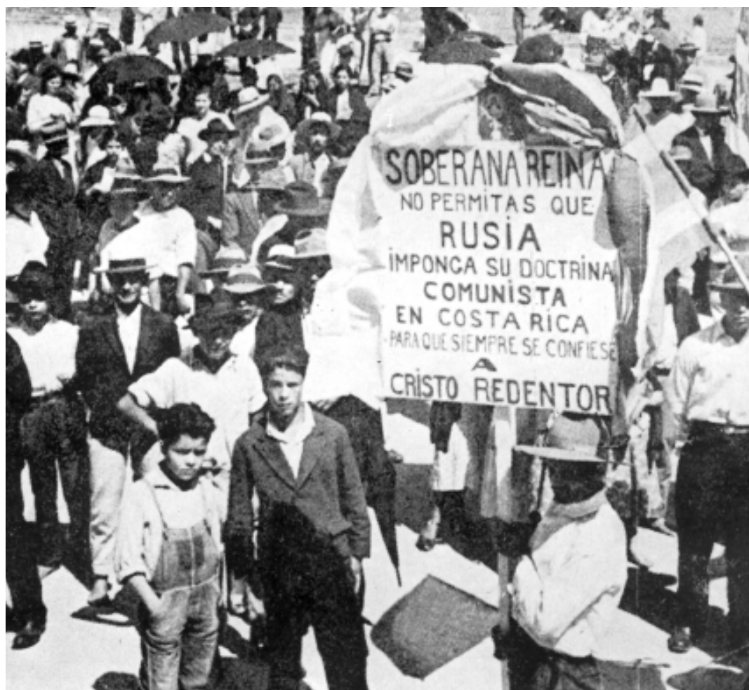
Tricentenario de la aparición de la Virgen de los Ángeles en 1935, una conmemoración fuertemente anticomunista (Borge, 1941: 576-577).

El énfasis en la asistencia a las urnas no era casual: un factor crucial en el éxito comunista de 1934 fue el elevado abstencionismo. La ley electoral de 1927 establecía que cuando había uno o dos escaños en disputa, la votación se definiría por mayoría relativa (ganaba el partido con más sufragios); pero si eran tres o más los asientos, se aplicaría el método proporcional, que consistía en dividir el total de votos entre las plazas en juego para obtener un cociente que sería utilizado para la adjudicación (Molina Jiménez, 2004b: 199-202). La escasa participa-