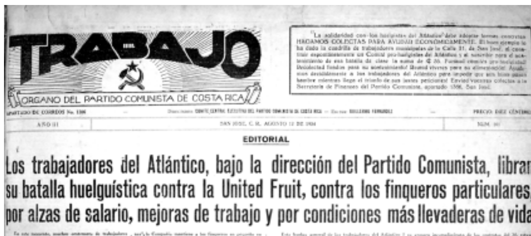
Trabajo informa sobre el inicio de la huelga bananera, el 12 de agosto de 1934.

por cooperar para generar más trabajo contribuye a una mayor prosperidad de la nación y a la seguridad de sus propias posesiones. Pero los capitalistas no lo ven de esa manera y siguen un curso peligroso (USNADF 818.00B/38, 1-VI-1932: 1-2).