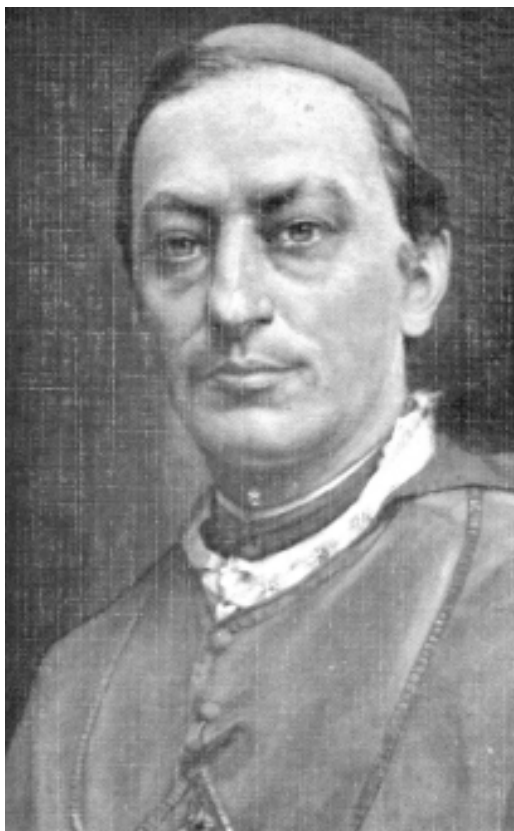
Bernardo A. Thiel (detalle, óleo sobre tela, de Enrique Echandi, 1903 (Colección Curia Metropolitana).

La desatención de las demandas populares, sin embargo, obedeció ante todo a que, tras el fallecimiento de Thiel en 1901 y la apertura democrática que el país experimentó después de finalizar el periodo autoritario de Rafael Iglesias (1894-1902) (Molina Jiménez, 2001a: 41-57), la jerarquía eclesiástica se esforzó por conseguir el suficiente apoyo en el Congreso para derogar la legislación anticlerical, tarea en la que contaron con el respaldo de un círculo de diputados devotos, liderados por el doctor Rafael Calderón Muñoz (Soto, 1985: 118-123 y 130-136). El catolicismo político, a tono con el viejo programa de la Unión Católica, prevaleció sobre el social.