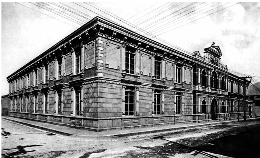
Figura 1. Biblioteca Nacional de Costa Rica, 1909.

En el cuadro 2 se presenta la procedencia de los libros según su lugar de impresión en las bibliotecas nacionales de El Salvador, Nicaragua y Costa Rica, los tres casos para los cuales se dispone de información para la misma década. La mayoría de los materiales provenía de Europa: en su conjunto, el 89,5% de los títulos y el 90,9% de los volúmenes. Las principales fuentes del establecimiento salvadoreño fueron Francia (1111 títulos), Italia (656 títulos) y España (280 títulos). La falta de datos para los otros dos países impide efectuar un cálculo parecido, pero es probable que la mayoría de las obras tuviera un pie de imprenta español o francés, una tendencia favorecida, en el caso costarricense, por la inmigración de impresores y libreros catalanes a San José, algunos de los cuales también tenían negocios en los otros países del istmo (Molina Jiménez, 1995, pp. 131-166).