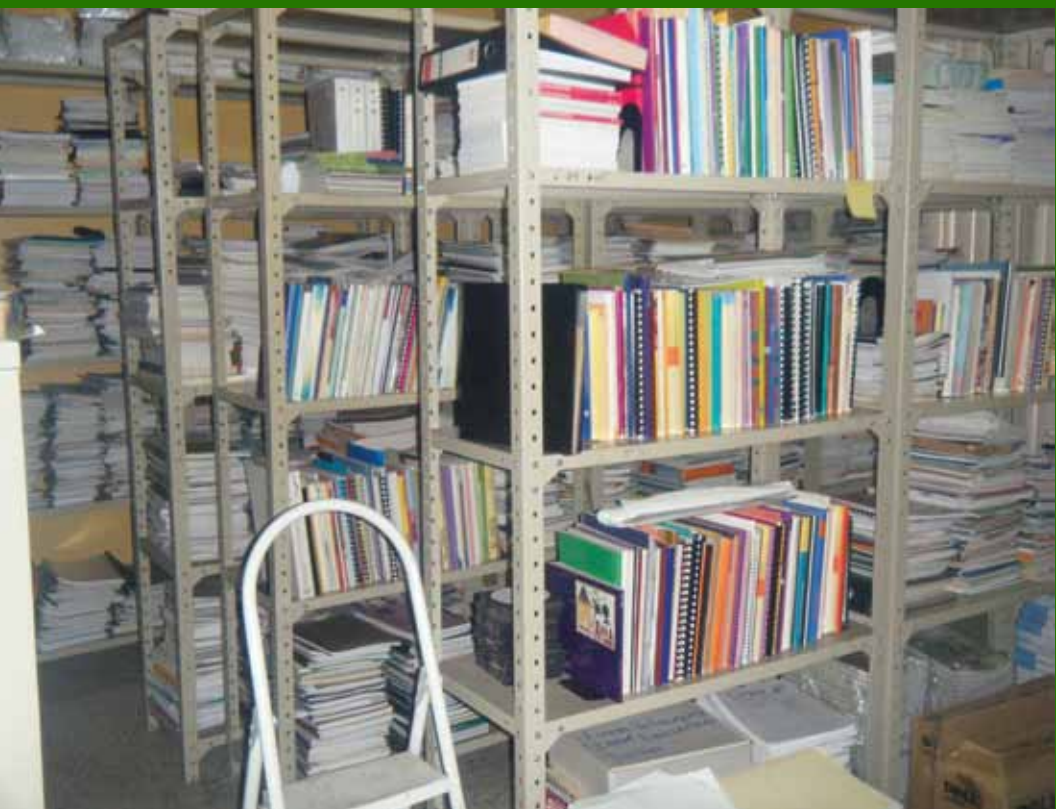
Colección documental del CD de INAM, Honduras, 2011