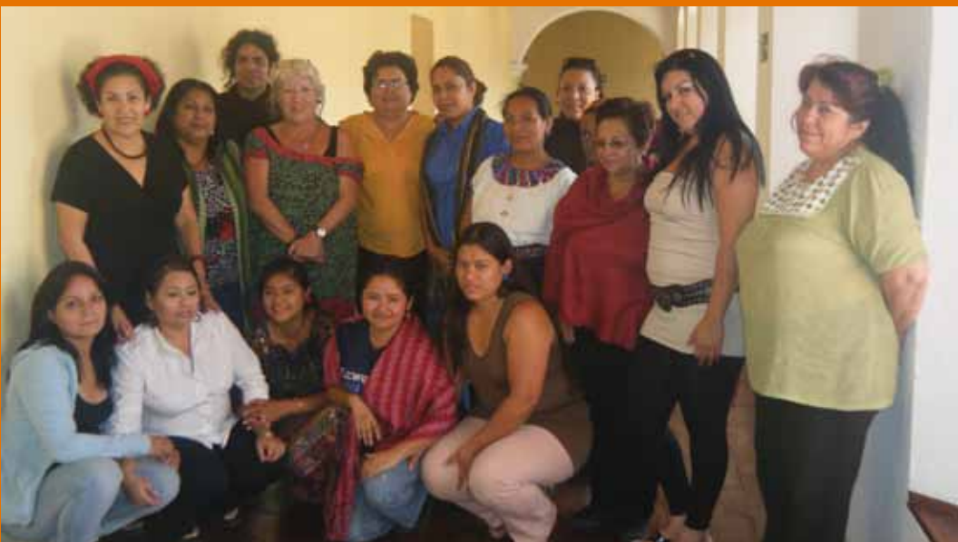
Taller sobre Recursos en Línea de CDMujeres, Antigua, Guatemala, agosto 2012