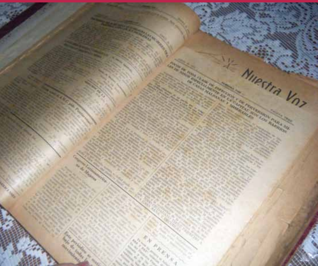
Compilación del periódico Nuestra Voz (1960), AMC, Costa Rica, 2011