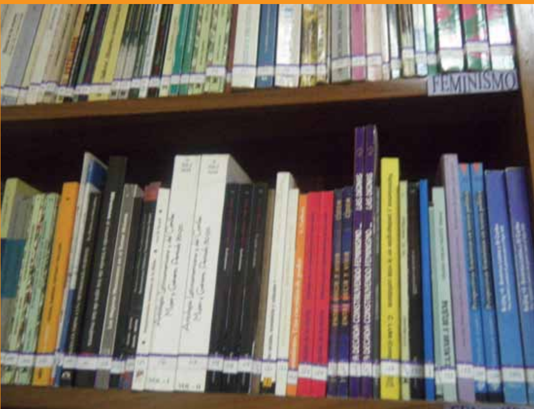
Colección documental del CD de Tierra Viva, Guatemala, 2011