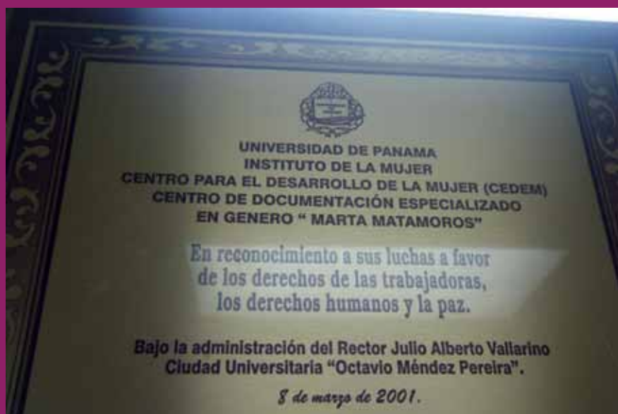
Placa del CD "Marta Matamoros" del INMU de la Universidad de Panamá 2011