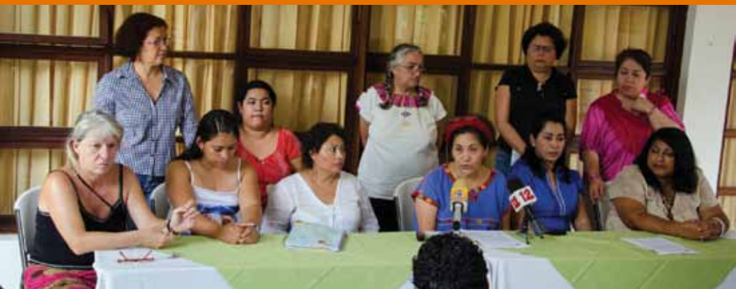
Una red que comienza. Taller de socialización del diagnóstico y constitución de la red. Managua, abril, 2012