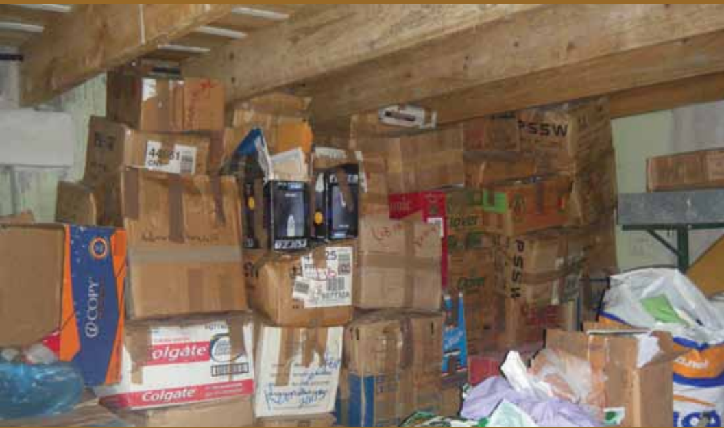
Colección documental, Las Chonas, Honduras, 2011