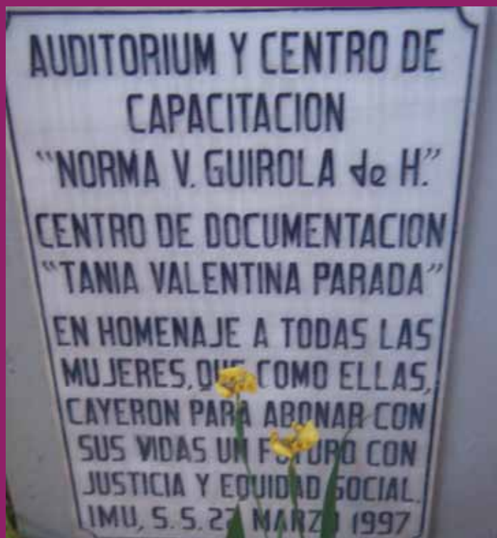
Placa del CD de IMU, El Salvador, 2011