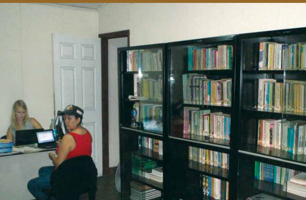
Colección documental, Las Chonas, Honduras, 2014