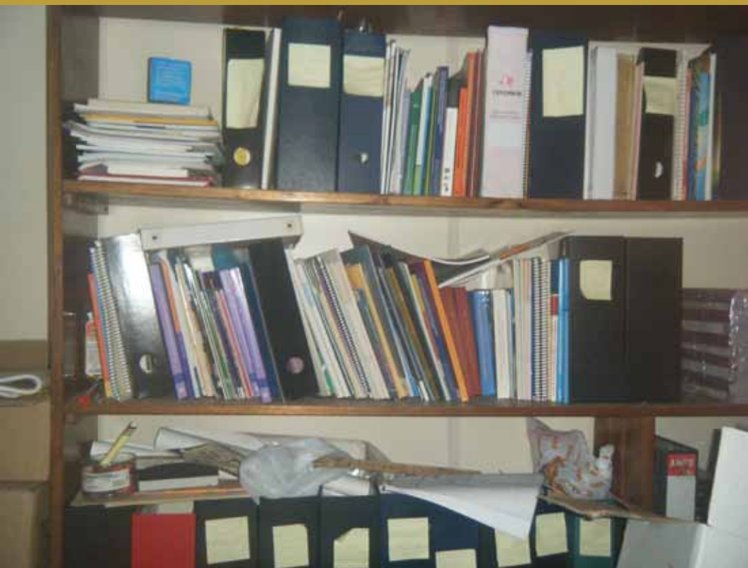
Parte de la Colección CEFEMINA, Costa Rica, 2011