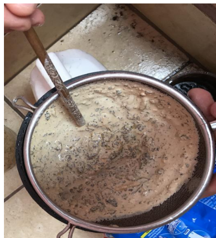
Fotografía N° 2 Proceso de colado de la savia del árbol de hule