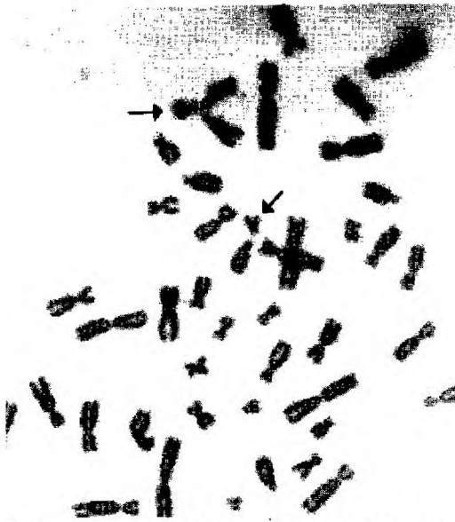
Fig. 1. Célula en metafase mostrando dos tipos de asociaciones sateliticas.

v Fox (1981) proponen un modelo para explicar la variación en la frecuencia de A.S. que contiene dos elementos: primeramente el genotipo determina la proporción de un tipo cromosómico a otro en el total de cromosomas asociados, y en segundo lugar están los factores ambientales, que influyen sobre la frecuencia absoluta de asociación sin alterar la tasa básica.