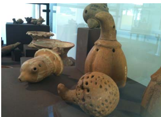
Figura 2 Ejemplo de las vitrinas que contienen artefactos pertenecientes a la colección Keith

Dicha exhibición ha buscado resaltar, más que la colección en sí, las razones por las cuales la misma salió del país, el papel que tuvo en la economía y otros ámbitos el empresario Minor Keith, así como el hecho histórico que representa el que por primera vez una instancia extranjera decidiera devolver volunta-