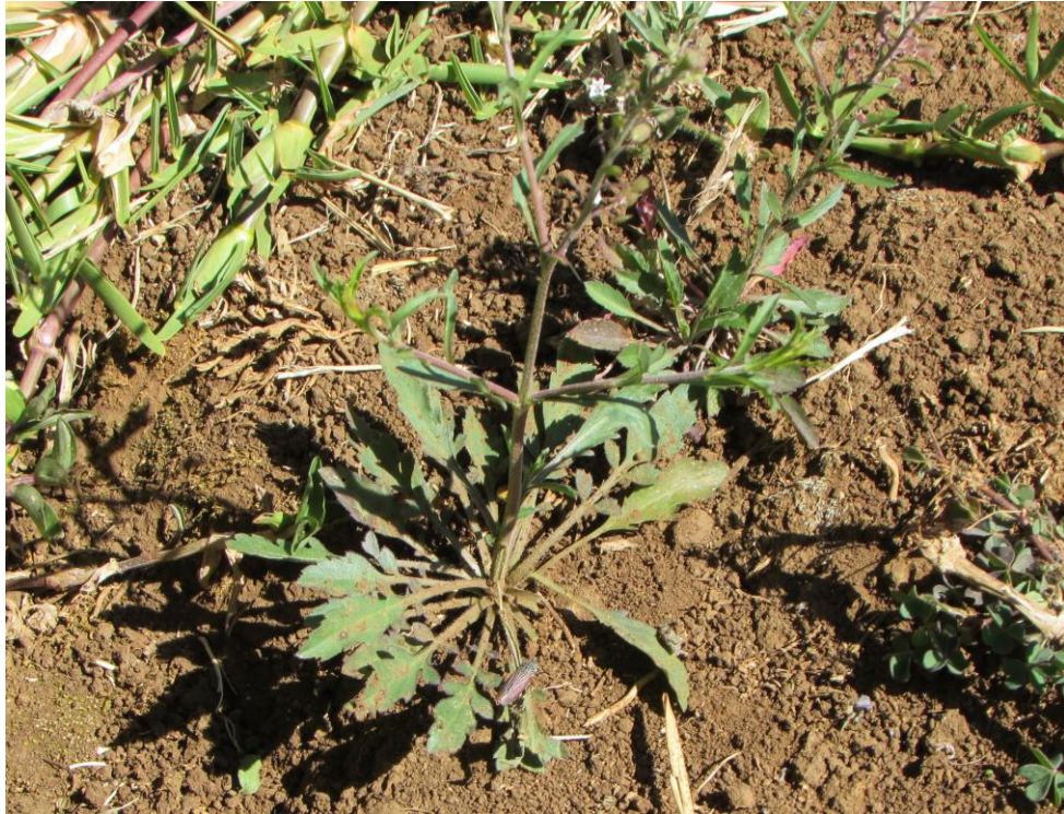
Figura 2. Planta de lentejuela creciendo en el campo; se observan las hojas basales que forman una roseta, y a partir de ella se desarrolla el tallo erecto.