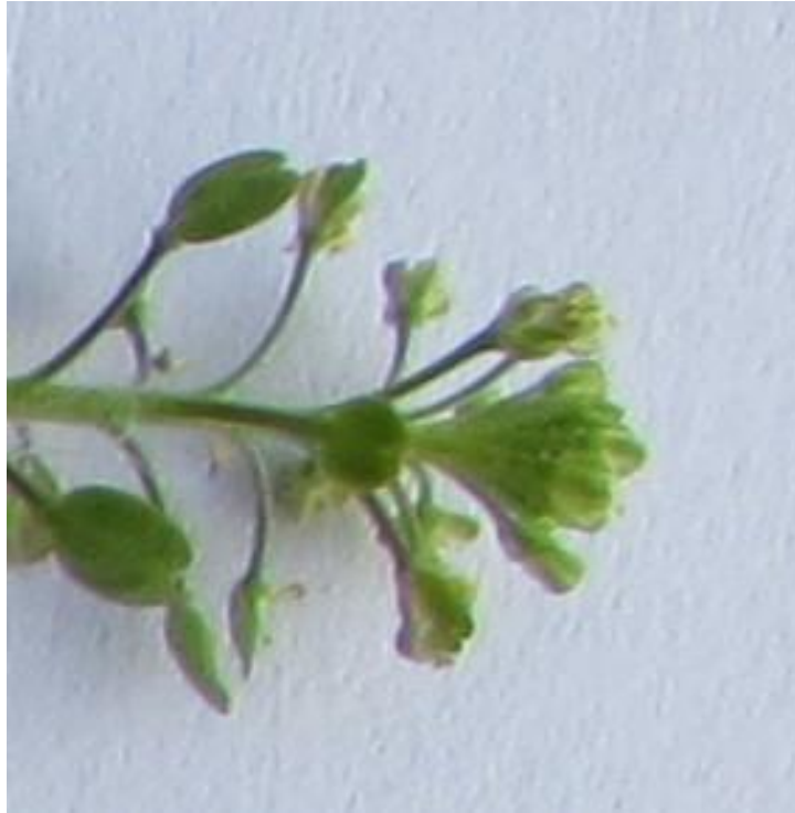
Figura 4. Detalle de las flores (de color blanco) de lentejuela, en el extremo apical de la inflorescencia (racimo), y frutos inmaduros hacia la base de la inflorescencia.