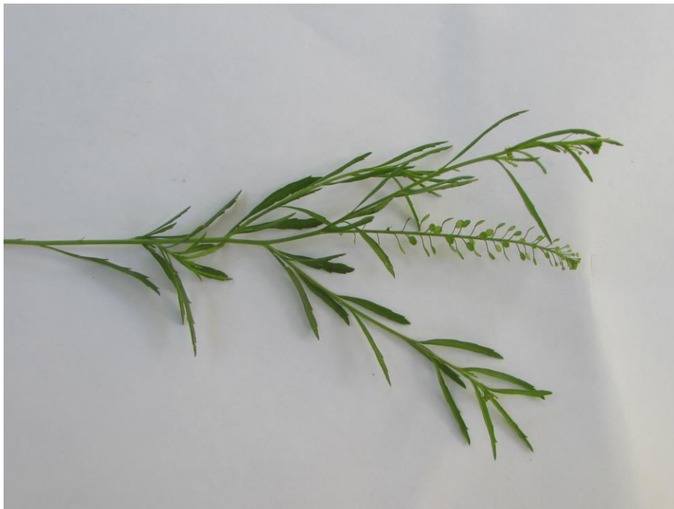
Figura 3. Detalle de las hojas de la parte superior del tallo de lentejuela; estas hojas son más pequeñas que las hojas basales de la planta.