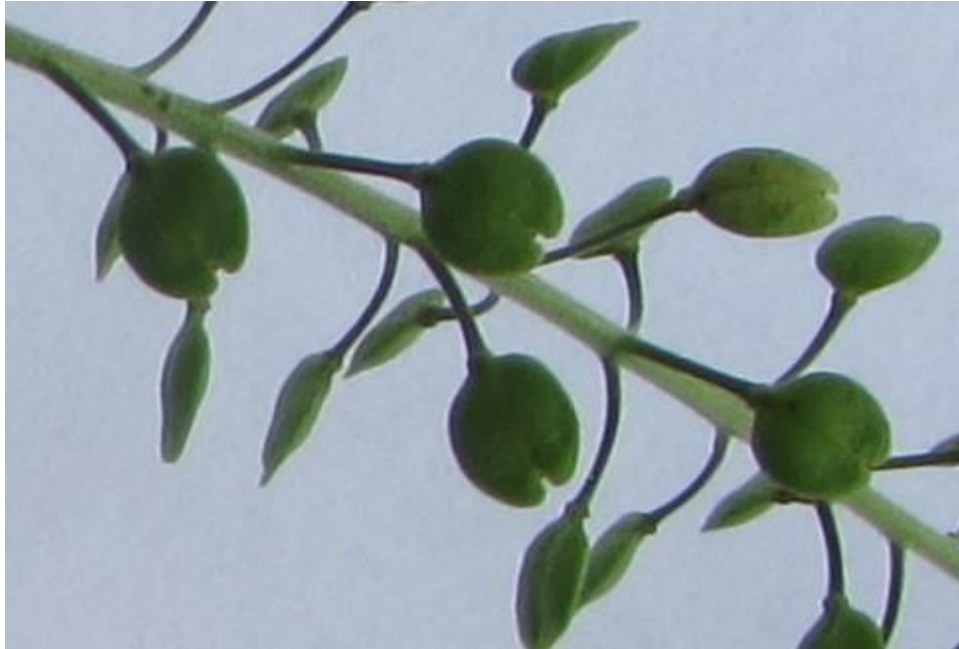
Figura 6. Detalle de la forma de los frutos de lentejuela.