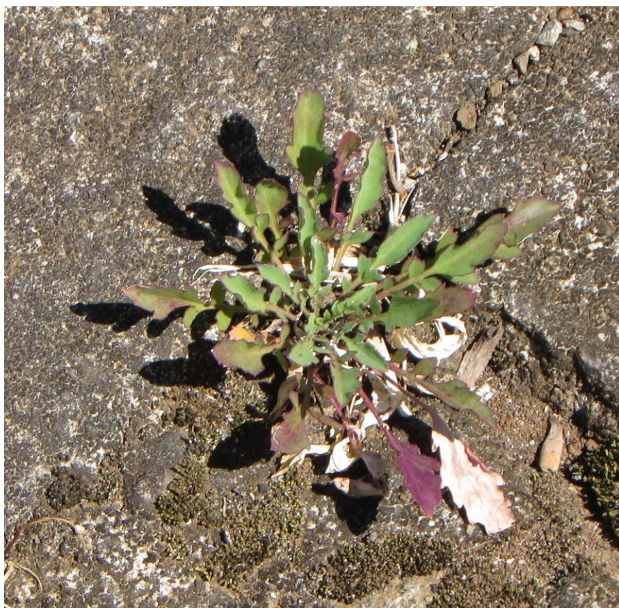
Figura 1. Planta de lentejuela creciendo sobre una superficie de cemento.

A continuación, se presentan algunas características morfológicas de las plantas de lentejuela.