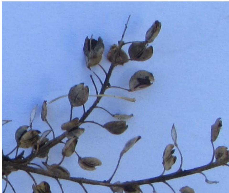
Figura 7. Detalle de frutos maduros de lentejuela. En este caso, los frutos ya se abrieron y las semillas se desprendieron al abrirse las valvas del fruto; cada fruto contiene dos semillas.