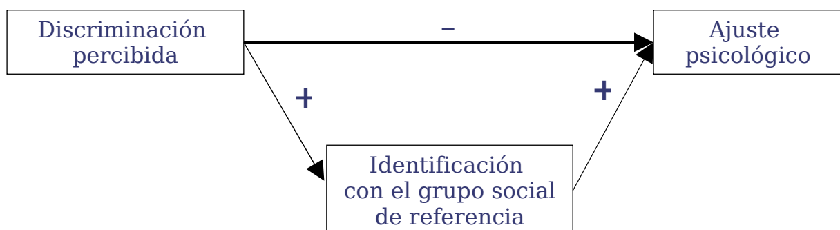
Figura 2. El Modelo Rechazo-Identificación. Adaptado de Schmitt & Branscombe (2002),

Estos principios han dado a lugar numerosos estudios sobre las estrategias que utilizan los miembros de grupos para manejar identidades sociales insatisfactorias y sus consecuencias en la percepción del sí mismo. Uno de los modelos más prominentes ha sido recientemente propuesto por Schmitt & Branscombe (2002), quienes suponen que miembros de grupos estigmatizados afrontan las consecuencias negativas del prejuicio con una mayor identificación con su grupo de referencia. Específicamente, su Modelo de Rechazo-Identificación ( Rejection-Identification Model ) predice que, bajo ciertas condiciones, la percepción del prejuicio lleva a una mayor identificación psicológica con el endogrupo, lo que a su vez permite atenuar los efectos negativos del estigma (ver Figura 2).