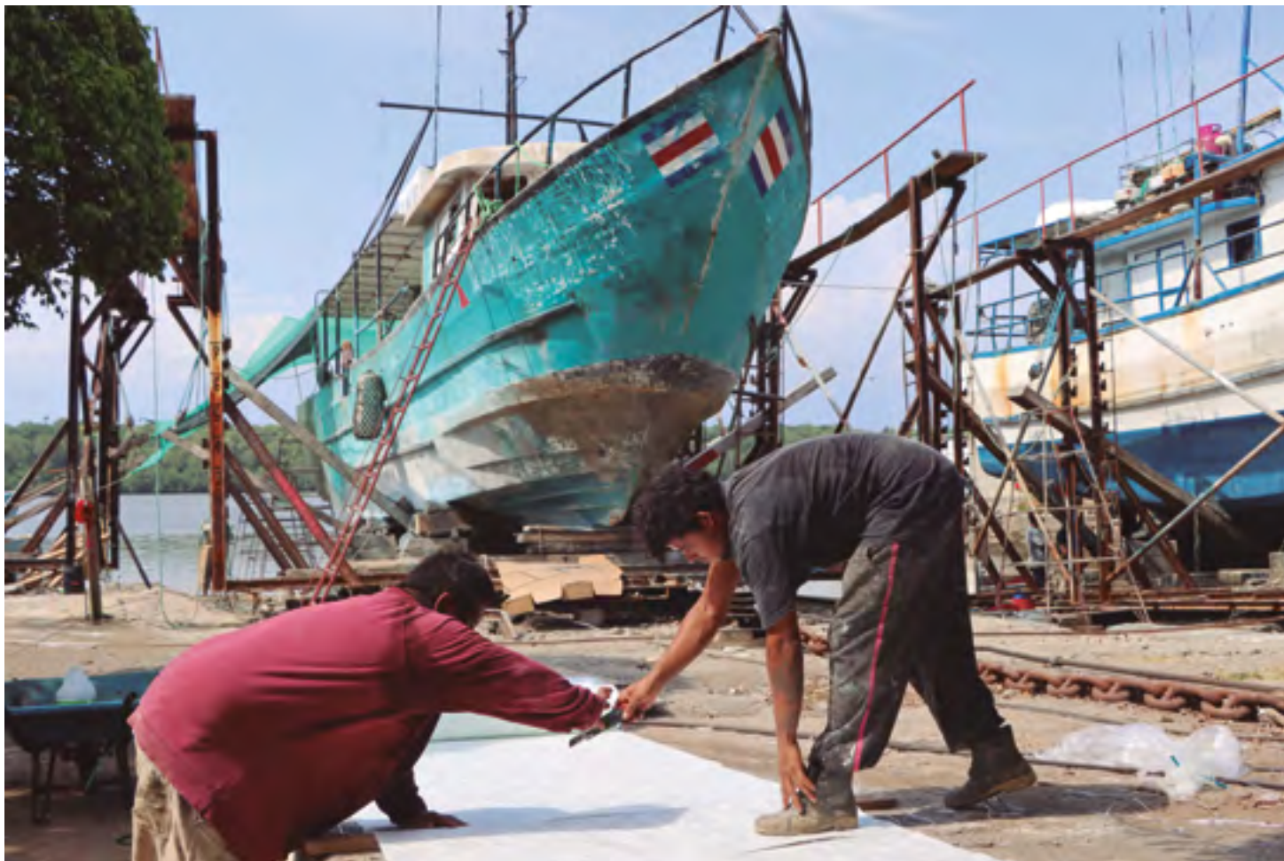
Proceso de corta de fibra de vidrio en segmentos para utilizarla como estabilizador. Los estabilizadores pueden llevar hasta 19 capas.

eléctricos, mecánicos y de refrigeración, así como los trabajos de pintura y acabados.