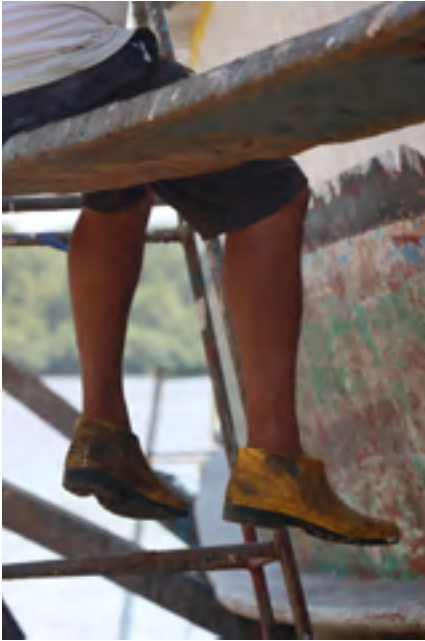
Procesos de pintura. Embarcación Atucal I .