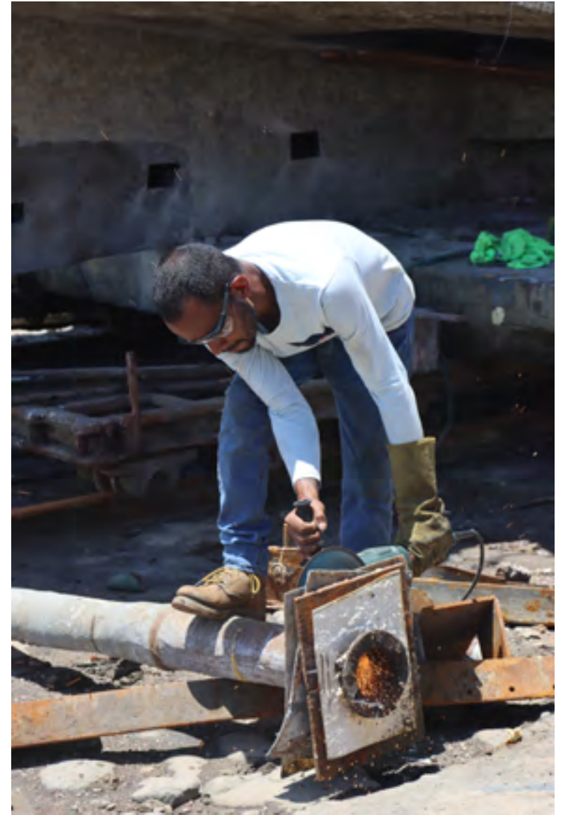
Proceso de reparación con soldadura.