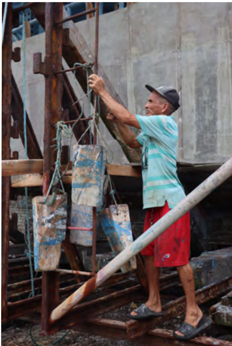
"Varón". Encargado de la revisión de los soportes de madera.

Organización de los estabilizadores de madera. Estos se utilizan debajo del barco para asegurar mayor estabilidad. Se colocan mientras la embarcación está en el estero y se mantienen cuando esta se encuentra en tierra.