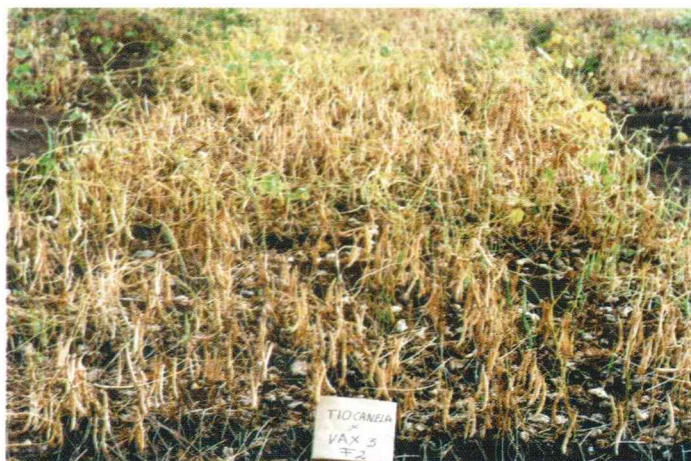
La selección de buenos padres es crucial en mejoramiento.