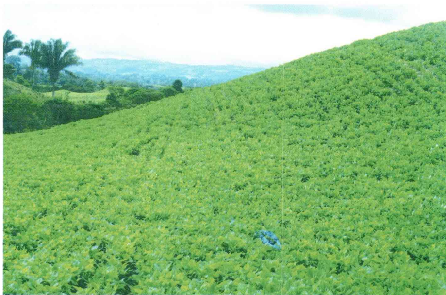
Con buen manejo, el frijol prospera bien en las laderas.

Nuevamente aprovechamos la oportunidad para invitar a los miembros de la red de las diferentes áreas de trabajo y disciplinas, a utilizar este espacio para dar a conocer a través de notas técnicas breves, los resultados, avances o logros de las investigaciones relacionadas en los países. Como se informó en el número anterior, también se puede incluir información sobre metodologías de trabajo, sobre reuniones o talleres, así como resúmenes de ponencias en reuniones científicas nacionales o internacionales. ●