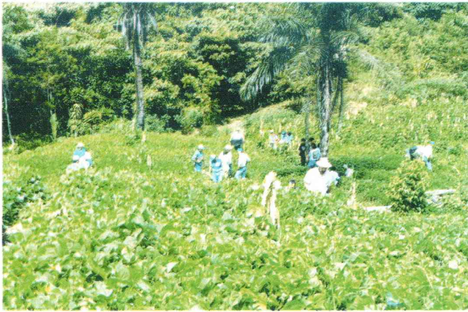
Evaluación de ensayos en campos de agricultores.