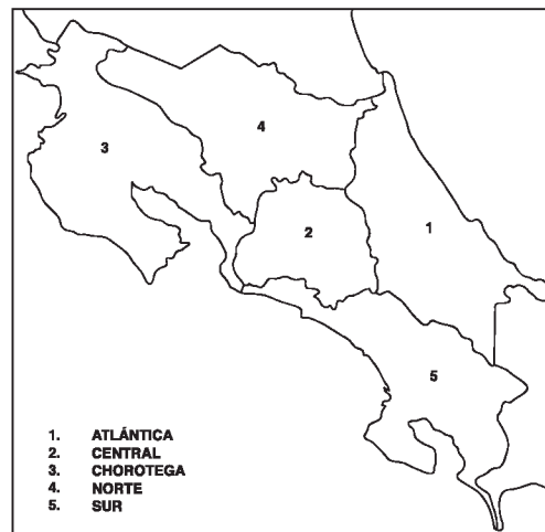
Fig. 1. Regiones geográficas de Costa Rica, atendiendo a los límites de la división territorial política.

Recolección de los datos: Los datos provienen de 2 196 individuos adultos de todo el país, de ambos sexos y no emparentados, que fueron examinados para la resolución de disputas de paternidad en el Departamento de Ciencias Forenses, Organismo de Investigación Judicial, del Poder Judicial de Costa Rica. Se determinaron los polimorfismos de los grupos sanguíneos ABO (ABO), Diego (DI), Duffy (FY), Kell (KEL), Kidd (JK), Lewis (LE), Lutheran (LU), MNSs (MNS), sistema P (P), Rhesus (RH) y Secretor (SE) y de la