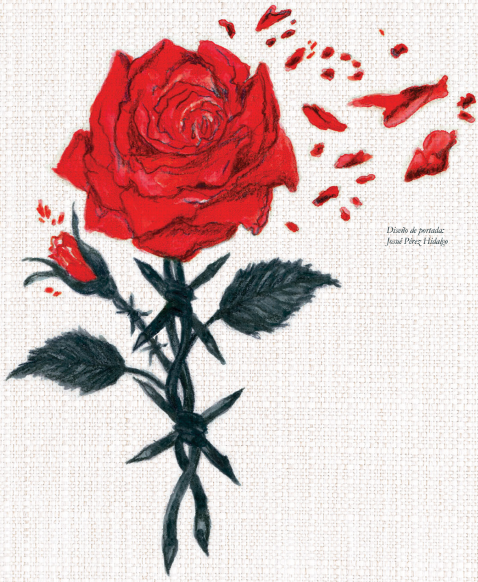
Diseño de portada: Joaquín Pérez Hidalgo

Taller literario: Reencuentro con los vivos