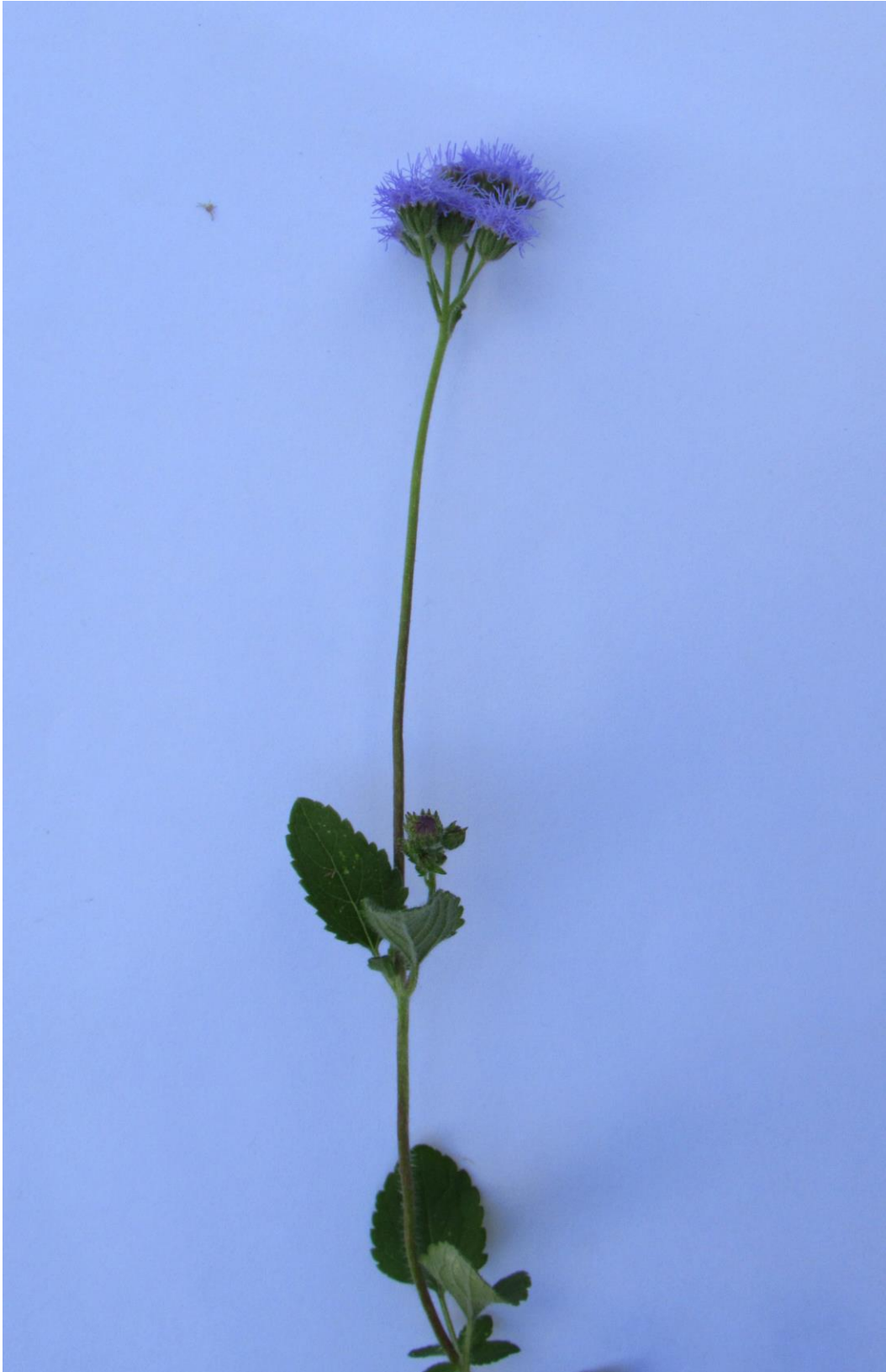
Figura 4. Tallo de una planta de santa lucía, con flores en el extremo apical.