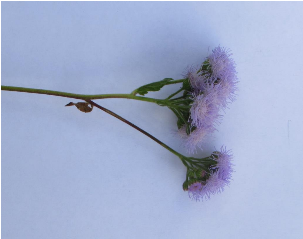
Figura 3. Flores de santa lucía, en plena antesis. Las flores se disponen en capítulos azul lila, con flores numerosas del mismo color.