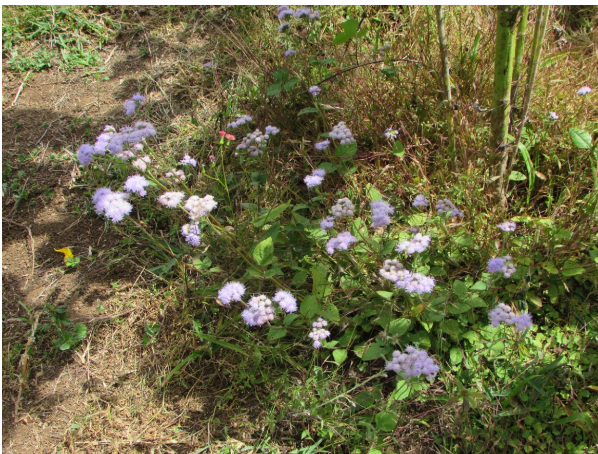
Figura 1. Plantas de santa lucía, creciendo en el campo.

A continuación, se presentan algunas características morfológicas de las plantas de santa lucía.