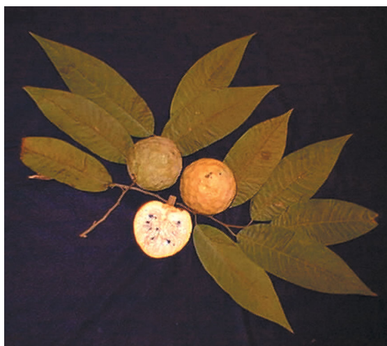
Figura 3. Annona reticulata .

familia y no por su utilización como fruta fresca. Su gran potencial de uso como patrón, especialmente para la A. muricata , se debe a que posee gran tolerancia a los terrenos inundados o cenagosos, que es donde habitualmente se le puede encontrar creciendo.