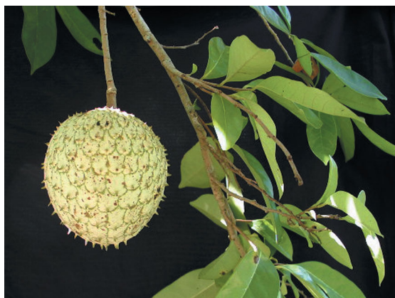
Figura 4. Annona montana .

utilizado como un excelente patrón para la guanábana, en lugares donde no exista la posibilidad de riego en el verano.