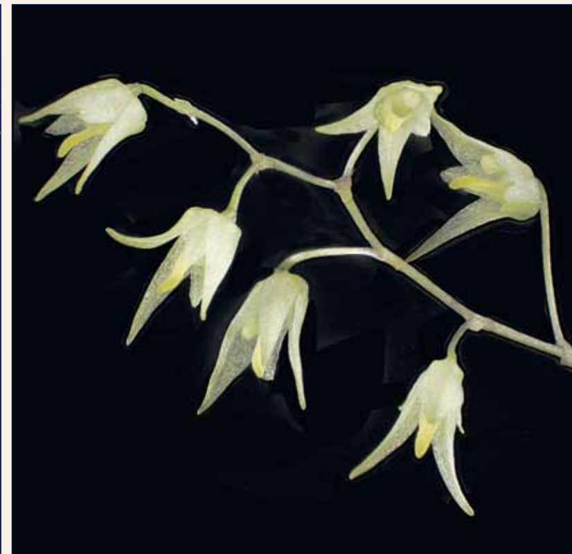
Trichosalpinx cedralensis , Blütenstand Trichosalpinx cedralensis , inflorescence