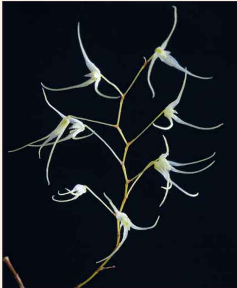
Trichosalpinx fruticosa , Blütenstand Trichosalpinx fruticosa , inflorescence

Die Ähnlichkeiten von Trichosalpinx arbuscula mit Arten von Anathallis hatte schon LINDLEY erkannt. Diese Ähnlichkeiten werden durch morphologische Ähnlichkeiten, wie das Vorhandensein von stielrunden Trieben, Blüentrieben länger als das Blatt und zugespitzten Sepalen untermauert (LINDLEY 1859, PRIDGEON et al. 2001). Trotz der Leistungsfähigkeit der durchgeführten phylogenetischen Untersuchungen