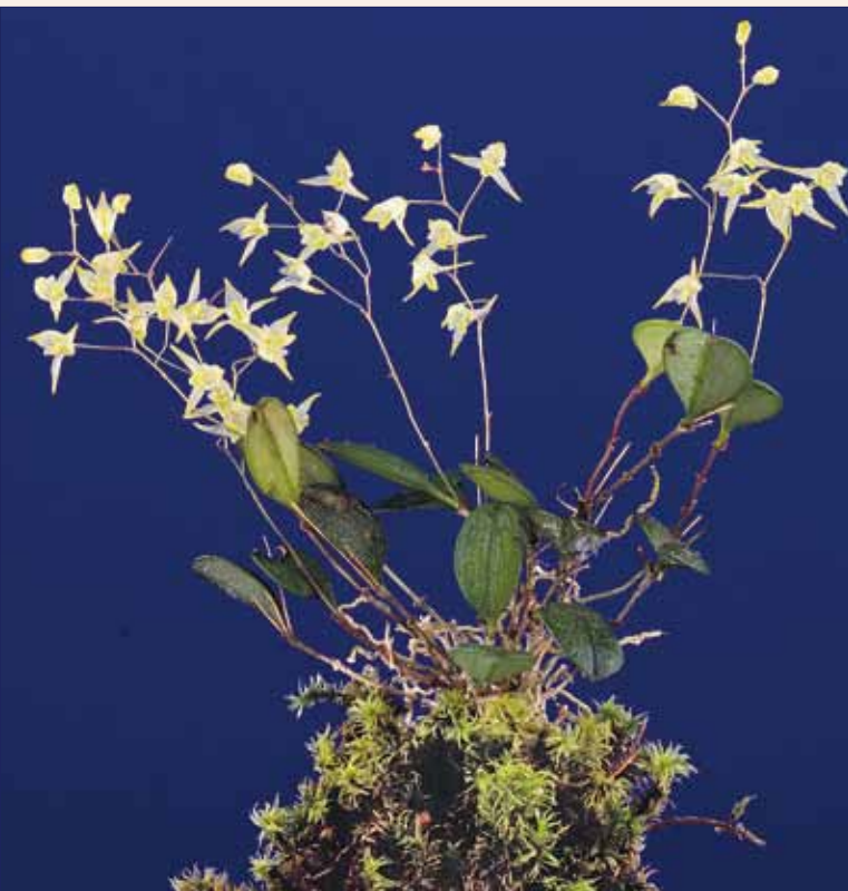
Trichosalpinx cedralensis , Pflanze Trichosalpinx cedralensis , plant