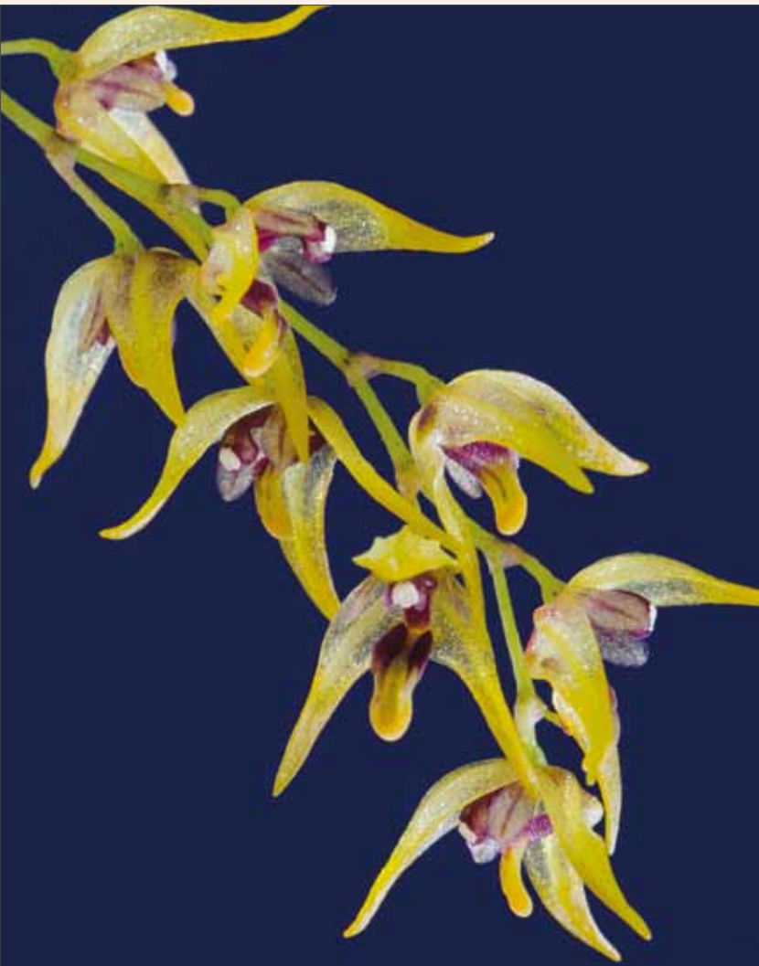
Trichosalpinx dura , Blütenstand Trichosalpinx dura , inflorescence

Die Arten der Untergattung Tubella können leicht verwechselt werden mit denen der Untergattung Trichosalpinx . Jedoch besitzt Trichosalpinx subgen. Trichosalpinx keine rhizomartigen Sprosse, bei denen ein neuer Trieb an der Spitze des vorhergehenden gebildet wird. Außerdem ist der Stängel kürzer als das Blatt, die Sepalen sind verwachsen und bewimpert (LUER 1997). Weiterhin können die Arten der Untergattung Tubella vegetativ verwechselt werden mit Arten von Lepanthes , Lepanthopsis , Draconanthes oder Neoreophylus . Diese besitzen ebenfalls Lepanthes -förmige Scheiden am Trieb. Aber es gibt zwischen ihnen mehrere Unterschiede der Blüten. Beispielsweise sind die transversalen, zweilappigen Petalen bei Lepanthes , die fleischigen Petalen bei Draconanthes , das