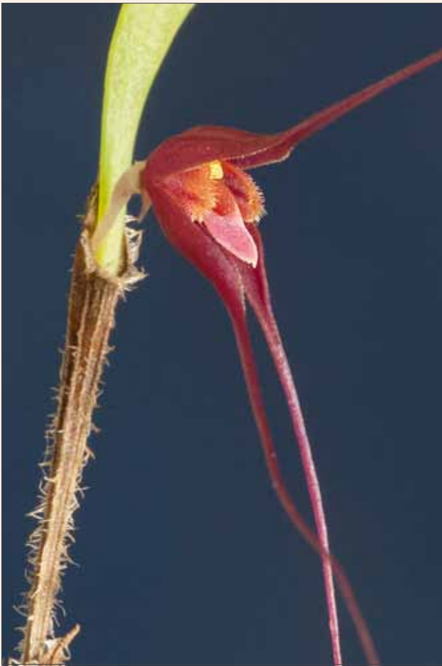
Trichosalpinx pergrata , Blüte Trichosalpinx pergrata , flower