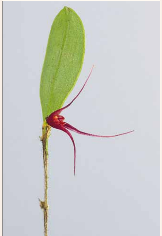
Trichosalpinx pergrata , Habitus Trichosalpinx pergrata , habit