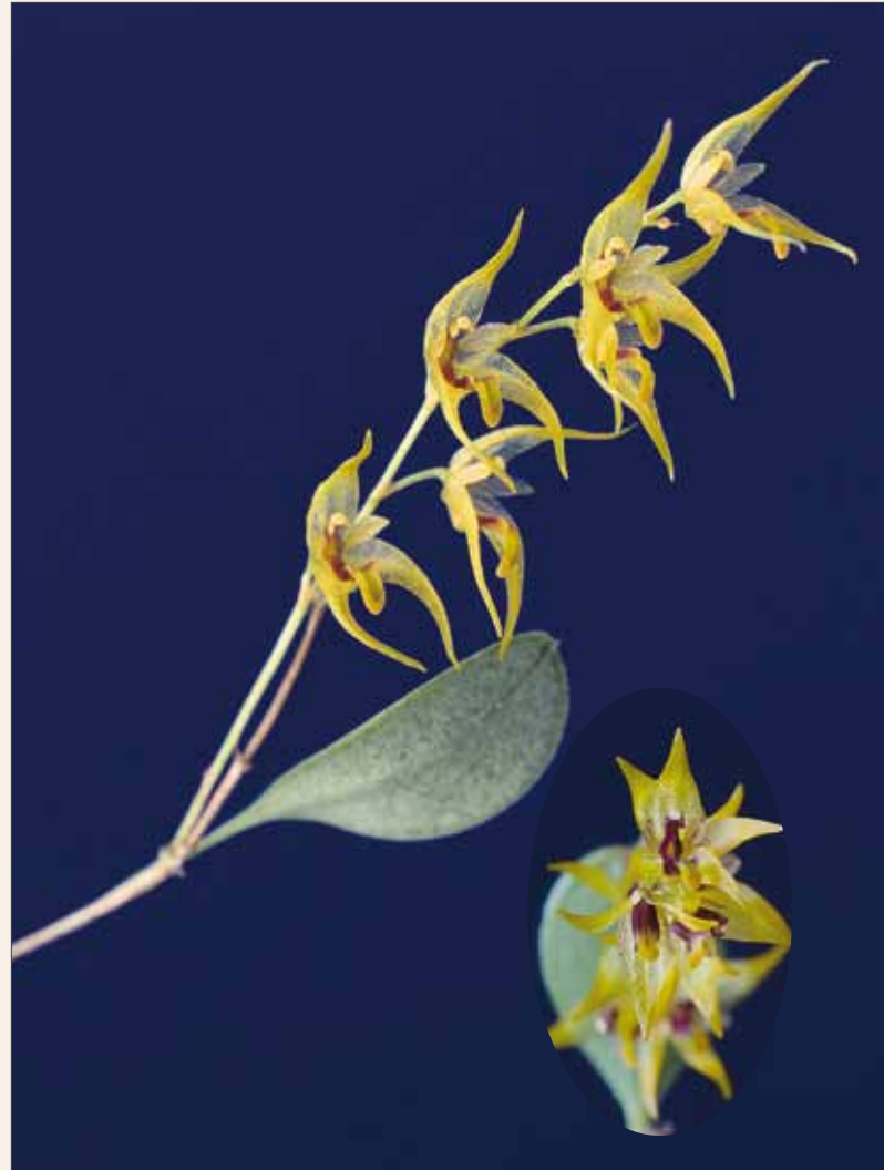
Trichosalpinx dura , Habitus und Einzelblüten Trichosalpinx dura , habit and isolated flowers

Der Name Tubella ist aus dem Lateinischen abgeleitet und bedeutet »kleine Röhre« wegen der entsprechenden Ähnlichkeit zu den schmalen, Lepanthes -förmigen Scheiden, die den Trieb umschließen. Die Blätter sind verkehrt eiförmig oder fast