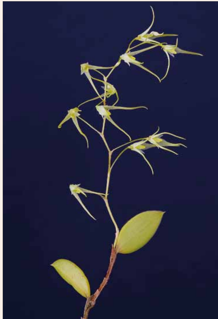
Trichosalpinx fruticosa , Habitus Trichosalpinx fruticosa , habit