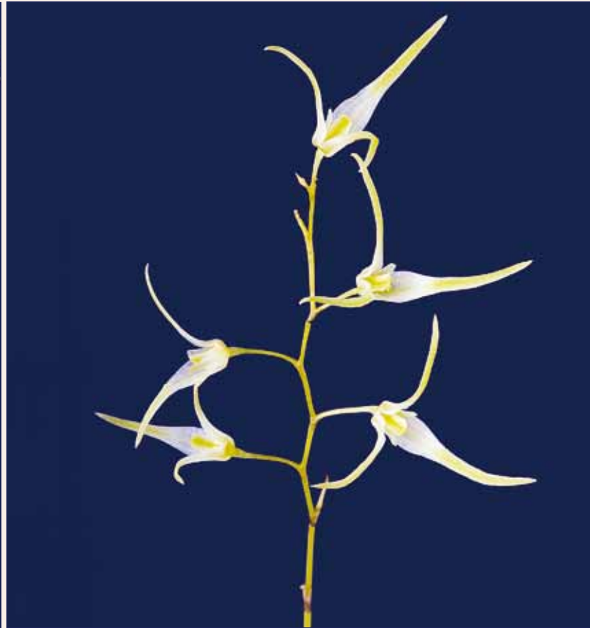
Trichosalpinx arbuscula , Blütenstand Trichosalpinx arbuscula , inflorescence