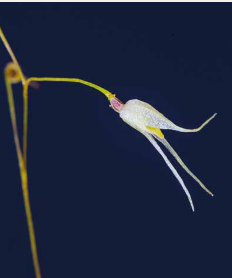
Trichosalpinx pusilla , Blütenstand Trichosalpinx pusilla , inflorescence

sind mehr Studien über die Bestäubung und die Bestäuber für diese Orchideengruppe notwendig, um die Rolle der Blütenmerkmale besser zu verstehen.