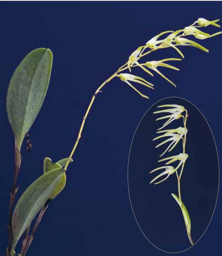
Trichosalpinx arbuscula , Habitus und Blütenstand Trichosalpinx arbuscula , habit and inflorescence