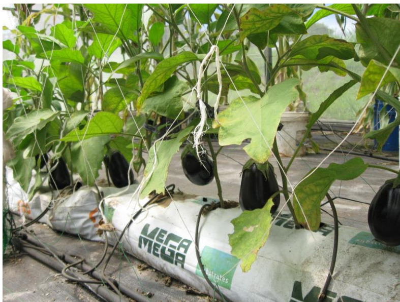
Figura 1. Cultivo hidropónico de berenjena Morada, en invernadero. Se observan los sacos con sustrato de fibra de coco.