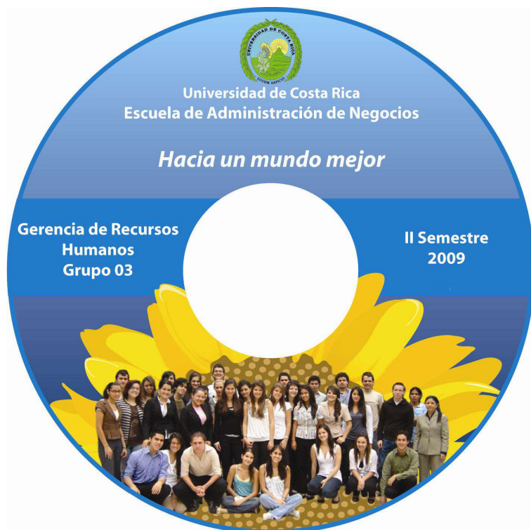
Figura 3.2. Carátula del CD que contiene el video.

modelo de educación superior, al menos en Administración de Negocios, que esté promoviendo y formando adecuadamente profesionales que garanticen un desarrollo de empresas y otras organizaciones con un verdadero sentido humano y por otra parte que sí es posible cambiar el rumbo que ha marcado la forma actual de enseñar y formar en el área de Administración. Se presenta seguidamente un análisis resumido de cada una de las actividades y medidas implementadas.