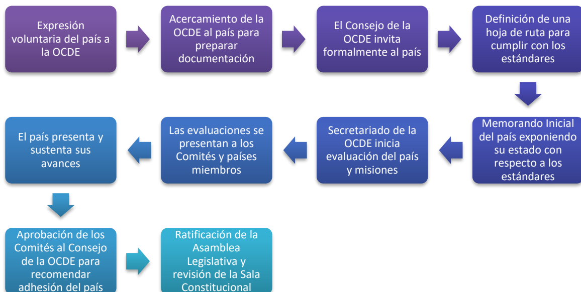
Ilustración 1. Flujo del proceso de ingreso a la OCDE.