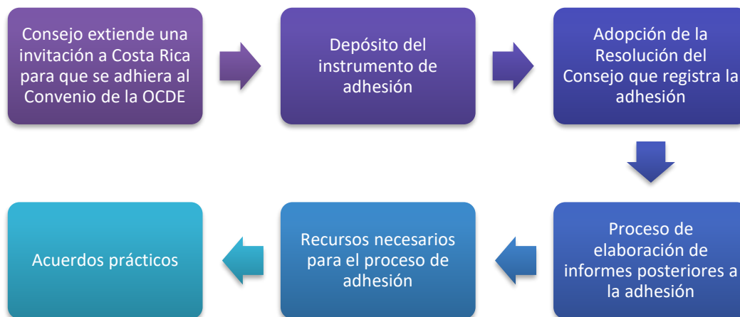
Ilustración 2. Flujo o proceso decisor de la adhesión a la OCDE

Con esta declaración por parte del país, se inicia el siguiente flujo o proceso decisor: