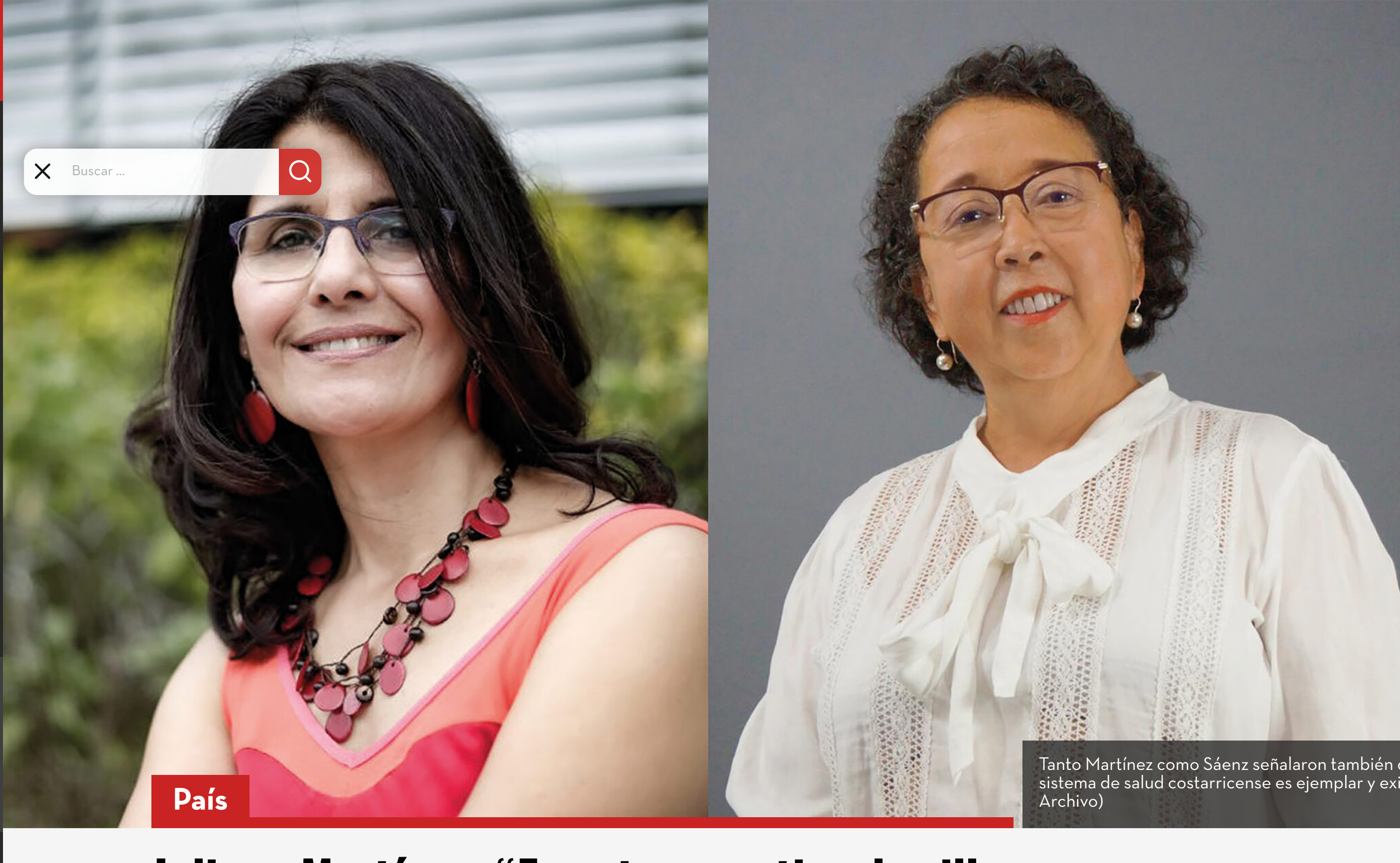
Tanto Martínez como Sáenz señalaron también que el sistema de salud costarricense es ejemplar y exitoso.