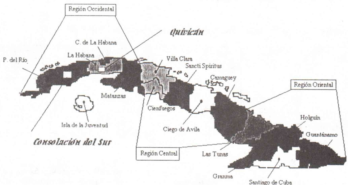
Figura 1. Zonas muestreadas.

Se recolectaron un total de 15 vainas con síntomas de Mancha Angular ( Plweoisariopsis griseola ) en la zona occidental: 10 de la provincia La Habana y 5 de la provincia de Pinar de Río. No fue posible la colección de muestras en las zonas central y oriental por no presentarse la enfermedad en las áreas muestreadas. En la Figura I, se señalan las zonas en las cuales hubo incidencia de la enfermedad. Las muestras fueron enviadas al Laboratorio de Patología de Frijol en el Centro Internacional de Agricultura Tropical (CIAT), gracias a la colaboración del Dr. Carlos Araya, para dar inicio a su estudio de caracterización molecular.