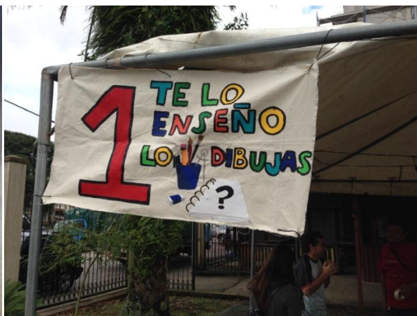
Manta Estación 1