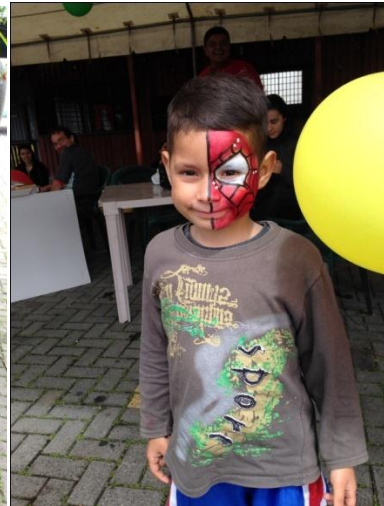
Estación Pinta Caritas