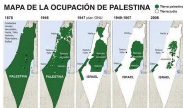
Figura 1. Mapa de la ocupación de Palestina