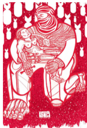
Ilga (Palestina y Chile), Palestina resiste , 2016.

No obstante, esta hegemonía es constantemente disputada, con lo que se podría decir que son actos contrahegemónicos. Esto se puede observar en la experiencia cotidiana, la memoria y el arte, donde el pueblo palestino produce contraimaginarios que rehúsan su desaparición. En este sentido, como sugiere Canclini (1990), las culturas no son esencias cerradas, sino procesos híbridos, marcados por tensiones y reapropiaciones. La resistencia palestina no se limita a la lucha armada ni a los discursos nacionalistas centralizados, sino que se expresa en formas diversas: el recuerdo de la Nakba, la afirmación del derecho al retorno, la transmisión oral, el arte urbano, la escritura, la reocupación del espacio, el simple hecho de seguir habitando la tierra. Estas prácticas inscriben una política del presente, donde la existencia misma se vuelve forma de disputa.