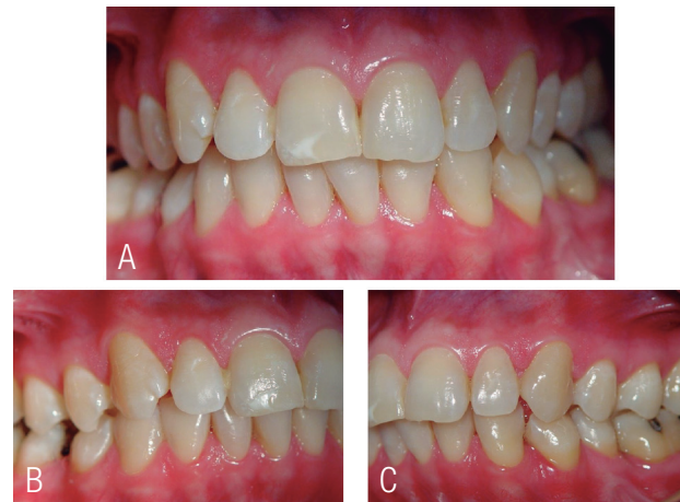
Figura 3. Control a ocho años del diagnóstico, donde se observa que no hay lesiones activas.

su estabilidad en el tiempo. En piel cuando ha tenido alguna lesión le ha resuelto fácilmente con tratamiento tópico enviado por el dermatólogo.