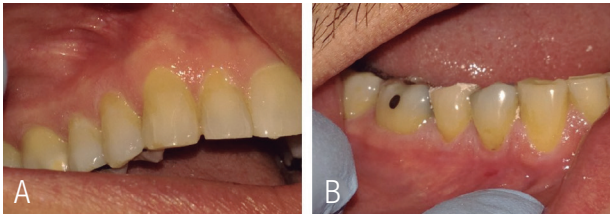
Figura 5. A y B. Control al mes de tratamiento donde se observa que no hay lesiones activas, solo algunas áreas blancas cercanas al margen cervical.

Sin embargo, el paciente no se ha adherido a un adecuado intervalo de mantenimiento periodontal y presenta un pobre control de placa bacteriana, lo cual es vital para la estabilidad y control en el largo plazo de este tipo de enfermedades.