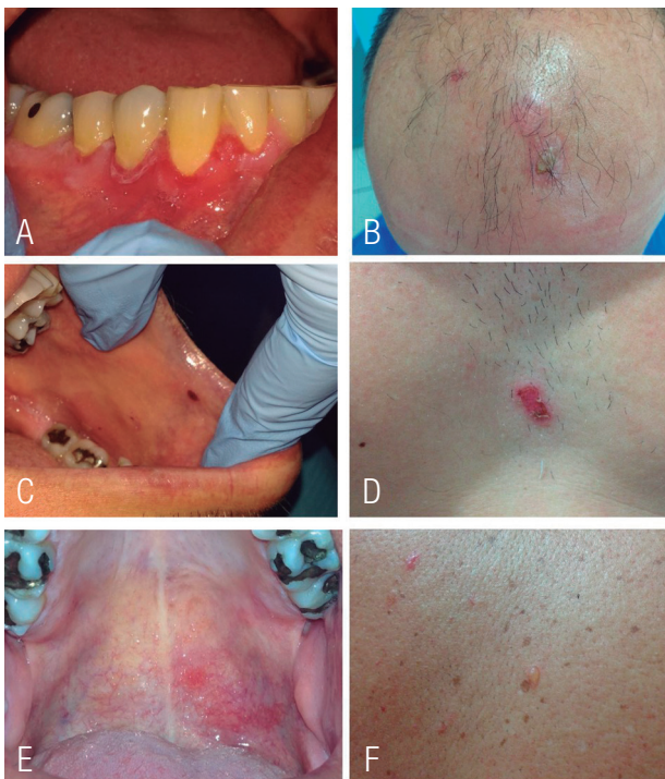
Figura 4. A, C y E. Úlceras sangrantes y dolorosas en toda la mucosa oral. B, D y F. Lesiones vesiculares y de tipo erosivo recubiertas por una costra en cuero cabelludo, pecho, espalda.

lesiones vesiculares y de tipo erosivo recubiertas por una costra en cuero cabelludo, pecho, espalda (Figura 4. B,D,F) y genitales, que le generan gran incomodidad y dolor, además, estéticamente le afectan en su trabajo y para socializar ya que por el aspecto a veces siente rechazo de las otras personas, dan impresión de descuido o desaseo y por la localización no siempre puede ocultarlas. Paciente refiere que inició hace tres meses en boca, luego en todo el cuerpo siendo el ardor y sensación de escozor terrible en el pene y cavidad oral. No se palparon adenopatías.