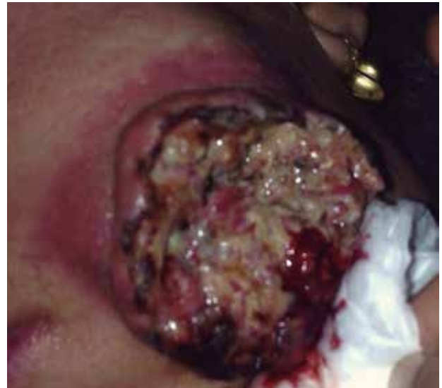
Figura 6. Lesión exofítica, ulceraciones, nódulos superficiales y desiguales con la presencia de necrosis.