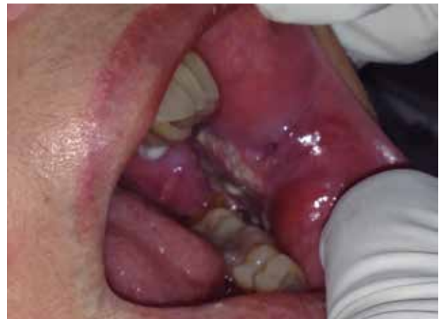
Figura 1. Inicial intraoral, mucosa yugal izquierda, lesión ulcerada, irregular, con induración, extendiéndose hasta la comisura, con áreas de leucoplasia y eritroplasia.

Realizados los estudios pertinentes se confirma el diagnóstico COCE en Etapa IV, fue un proceso desgastante y angustiante tanto para la paciente como para la familia. Le dieron 10 sesiones de radioterapia durante diez días continuos, la paciente fue asistida por un equipo multidisciplinario por un período de 5 meses, sin embargo, el proceso patológico estaba muy avanzado y sumado al compromiso sistémico lamentablemente la paciente falleció.