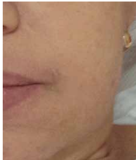
Figura 2. Inicial extraoral, no se observaron alteraciones de contorno facial o en piel.