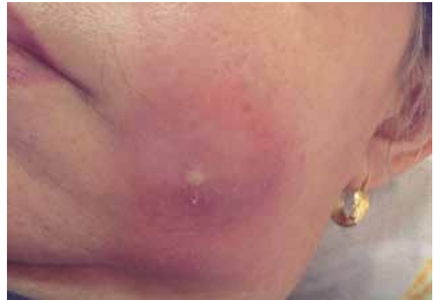
Figura 5. Fístula en mejilla a los quince días del hallazgo clínico.