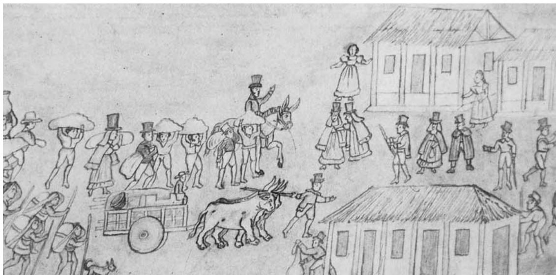
Los comienzos de San José en el siglo XVIII, “Álbum de Figueroa”.

(González Flores, 1978: 42-44, 48, 51), términos que evocan los empleados, con el mismo propósito, en el Buenos Aires de 1820 (Newland, 1994: 277-286).