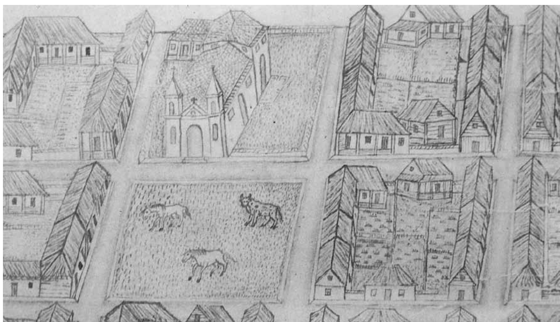
Cartago a inicios del siglo XVII, “Álbum de Figueroa”.

En lo tocante a Costa Rica la situación no es muy distinta, ya que las únicas tres investigaciones que exploran el periodo anterior a 1850 (González Flores, 1978: 17-173; Muñoz, 2002: 3-89; Quesada, 2007: 95-167) basan sus conclusiones en información similar a la utilizada por Herrera. En contraste, el presente