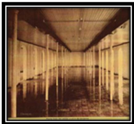
Interior de uno de los salones del Hospicio de Incurables.