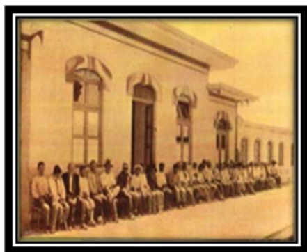
Primeros salones del Hospicio de Incurables.