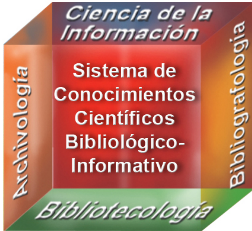
Figura 1: Disciplinas núcleo del Sistema de Conocimientos Científicos Bibliológico-Informativo.

Otro argumento que se sustenta en la Teoría Bibliológico-Informativa se centra en el origen de este núcleo disciplinar, el cual es concebido a partir de otras disciplinas denominadas “rectoras” debido a las aportaciones que estas disciplinas han hecho a cada una de las que integran el núcleo y entre las cuales se encuentran la Bibliología , la Historia , la Metodología de la Investigación , la Comunicación y la Administración . De igual forma se reconocen en esta teoría la presencia de un conjunto de disciplinas provenientes de las Ciencias Exactas, Naturales Sociales y Humanas, tales como la Computación , la Matemática , la Estadística , la Sociología , la Lingüística , la Psicología , la Filosofía , la Economía , las Ciencias Políticas , el Derecho , entre otras, que en gran medida han contribuido con el desarrollo y consolidación de este Sistema de Conocimientos Científicos (Ver Figura 2).