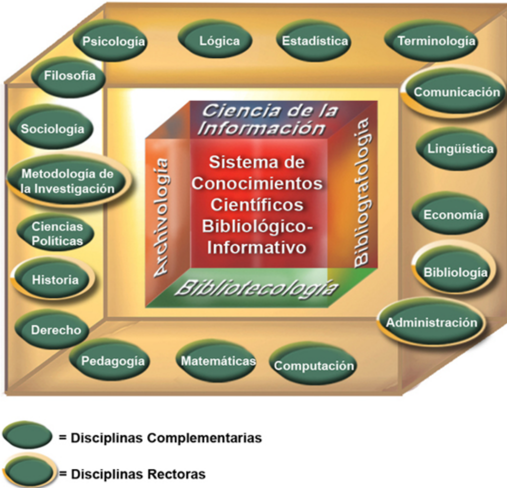
Figura 2: Disciplinas rectoras y complementarias del Sistema de Conocimientos Científicos Bibliológico-Informativo.

Este proceso de interpenetración y de intercambio de conocimientos científicos que opera entre las disciplinas científicas que integran el núcleo y las provenientes de otros campos y sistemas de conocimientos diferentes, conocido en la Ciencia Moderna como el fenómeno de integración y diferenciación de la Ciencia; tiene un carácter reproductivo al interior de las Disciplinas Núcleos, modificando su lenguaje formal, su aparato conceptual y propiciando el origen de nuevas especializaciones, tales como: las Tecnologías de la Información y las Comunicaciones (TIC), la Lingüística Documentaria , la Gerencia de Instituciones de Información , la Bibliometría , la Informetría , la Bibliotecometría , la Archivometría , la Psicología de la Información , los Estudios de Usuarios , las Políticas de Información , la Economía de la Información , la Sociología de la Lectura y más recientemente otras provenientes de la Computación y específicamente de la Organización y Estructura de Datos como la Minería de Datos , la Bibliominería , la Minería de Texto , el KDD (Knowledge Discovery in Data Base) , el OLAP (Online Analytical Processing) , por sólo citar algunos ejemplos. Relaciones que aparecen identificadas en la Figura 3.