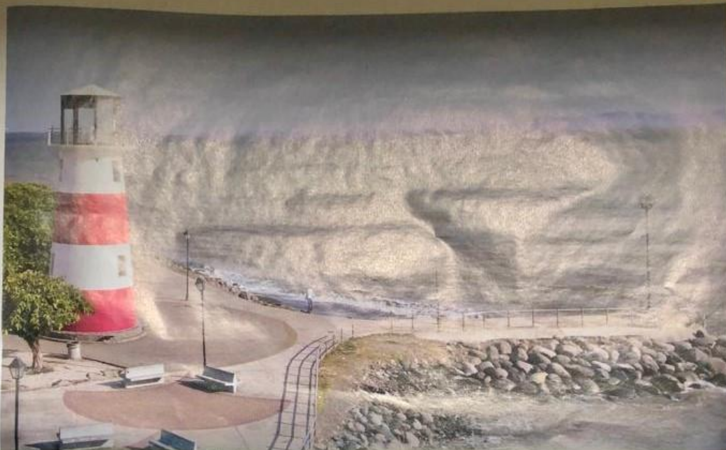
La propuesta de la Sede del Pacífico de la UCR pretende contribuir a dinamizar la actividad económica de Puntarenas.