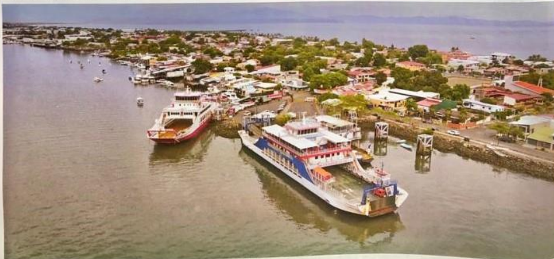
La provincia de Puntarenas es la primera en el país en promover la reactivación económica mediante una herramienta tecnológica como los códigos QR.