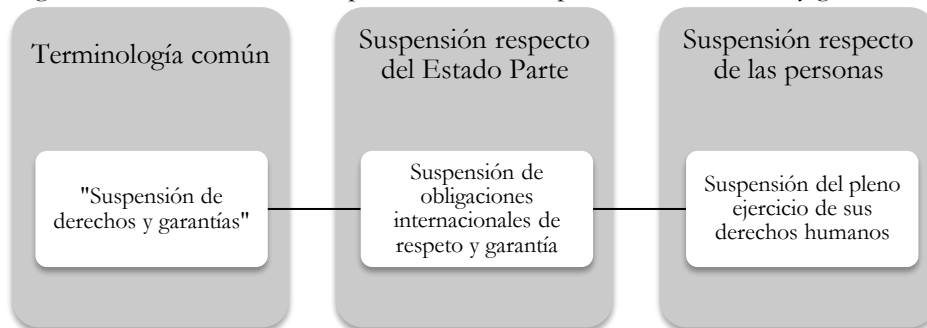
Figura No. 1: Precisión conceptual sobre la “suspensión de derechos y garantías”.

Por tales motivos, cuando se aluda a la “suspensión de derechos y garantías”, el término debe precisarse en la suspensión de obligaciones internacionales (respecto del Estado Parte) y, a su vez, del pleno ejercicio de los derechos humanos (respecto de las personas); lo cual, para efectos didácticos, se resume en la Figura No. 1: