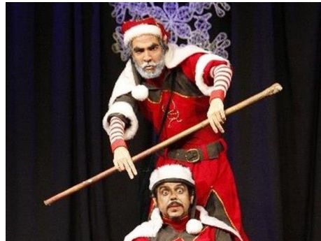
Ilustración 5 “El ogro de las nieves” Teatro El Triciclo