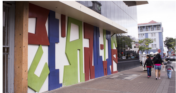
Figura 3 Manuel de la Cruz González. Mural espacial . Edificio de Tributación Directa, San José.