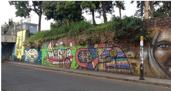
Figura 1 Grafiti en San José.