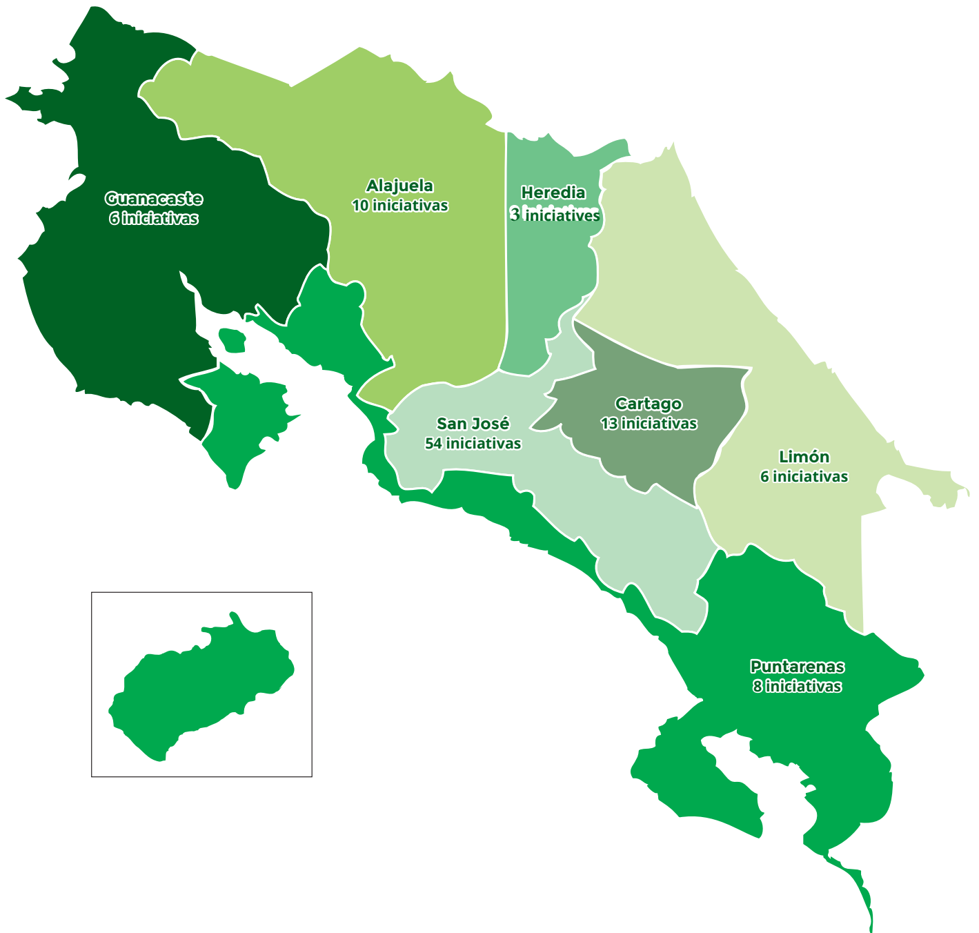
Gráfico 1. Distribución de las iniciativas por provincias