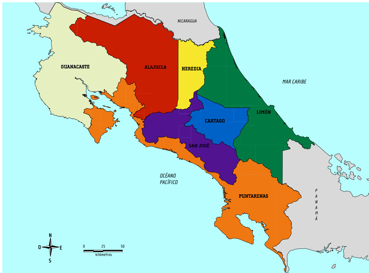
Costa Rica: Mapa de Provincias