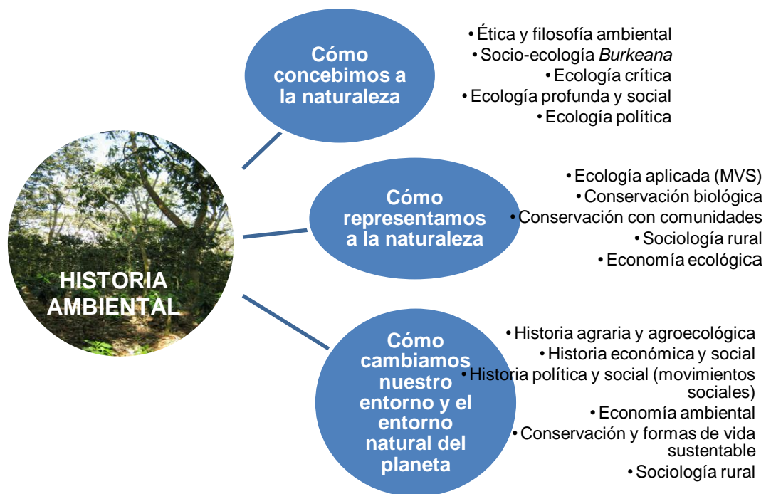
Figura 1. Confluencias de la historia ambiental con otras disciplinas. Elaboración propia.