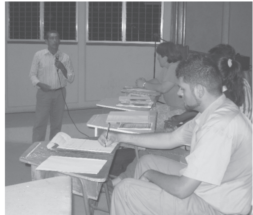
Fotografía 1 y 2

Presentación oficial del equipo de investigación.