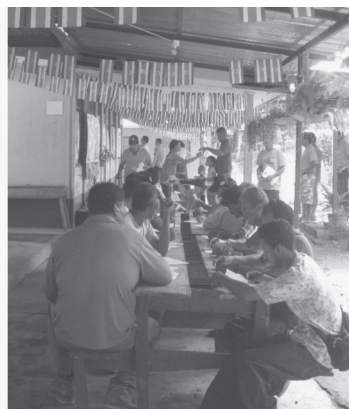
Fotografía 5 y 6 Reuniones en la comunidad de Jicaro y Bocana. Fuente: ProDUS, 2008

Como parte de los resultados obtenidos se clasificaron las opiniones en categorías que agruparan las opiniones de los participantes, de esta manera se generaron las categorías generales de vinculantes o no con el proyecto Plan Regulador y cada uno de estos se dividen en las siguientes sub categorías: actividades productivas, áreas recreativas y espacios públicos, zonas para reubicación de los pobladores que estén en la zona pública, zona institucional y centros de acopio o mercado para pescadores.