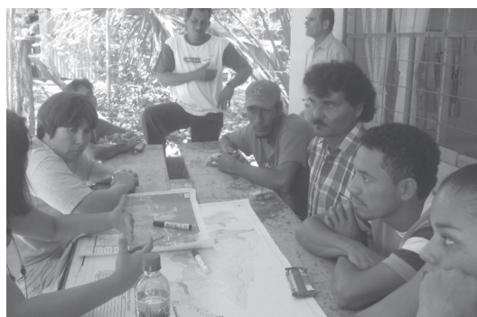
Fotografía 8 Trabajo con mapas durante las reuniones de propuestas, Bocana.