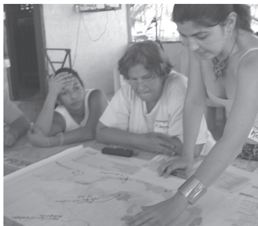
Fotografía 7 Trabajo con mapas durante las reuniones de propuestas. Comunidad de San Antonio, 2009.

En la figura 3 presenta el mapa de zonificación del Plan Regulador antes y después de realizadas las reuniones de prepropuestas con los vecinos de la isla.