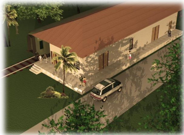
Vista de la Estación , fachada Sur y Oeste Modelo 3d Víctor Hernández Pridybailo 2008