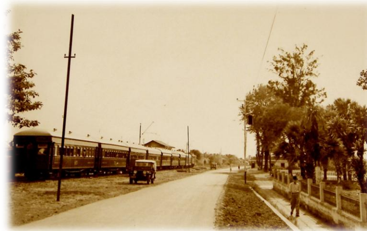
Vista de la calle paralela a la línea férrea en San Antonio. Gonzalo Sánchez Villegas. Alrededor de 1950.

y cómo su valor trascendió mucho más allá del meramente económico, de brindar un servicio público, pues se convirtió en un brazo más del cuerpo de la cotidianidad para muchos. El ferrocarril representó no sólo un medio de transporte, como lo podríamos pensar al comparar su antiguo semblante con el que hoy se está reactivando, sino todo un suceso en la unión de los pueblos, en el trabajo duro de cientos de obreros y un medio para el impulso de la economía del país.