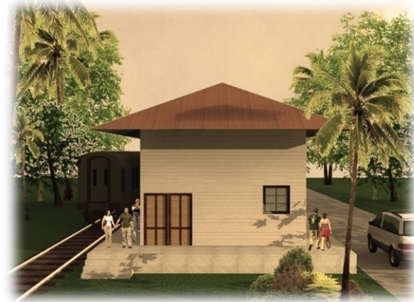
Vista de la Estación , fachada Oeste. Modelo 3d Víctor Hernández Pridybailo 2008