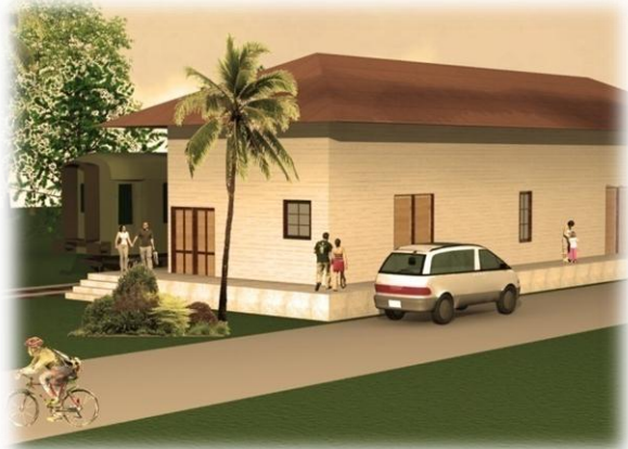
Vista de la Estación , fachadas Este. Y Norte Modelo 3d Víctor Hernández Pridybailo 2008