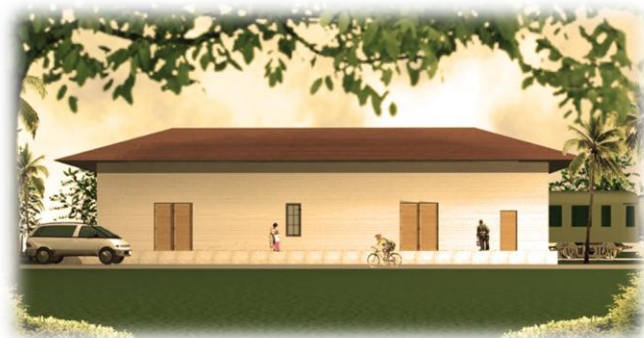
Vista de la Estación , fachada Sur Modelo 3d Víctor Hernández Pridybailo 2008