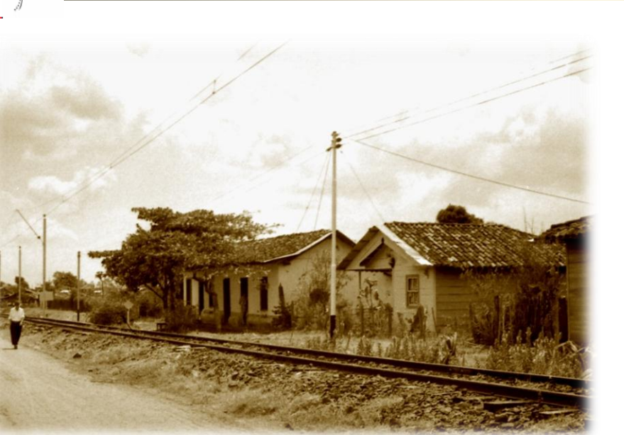
Vista de la línea férrea. Gonzalo Sánchez Villegas. Alrededor de 1950.