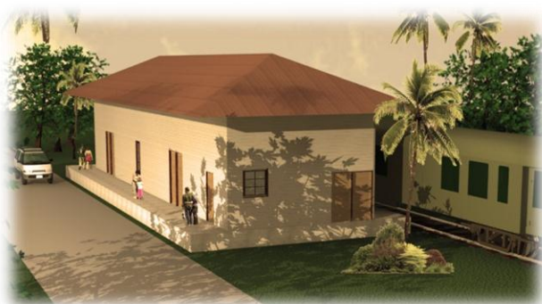
Vista de la Estación , fachada Sur y Este Modelo 3d Víctor Hernández Pridybailo 2008