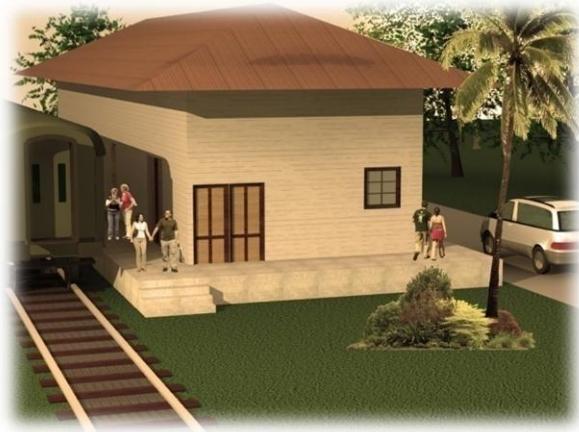
Vista de la Estación , fachada Este. Modelo 3d Víctor Hernández Pridybailo 2008