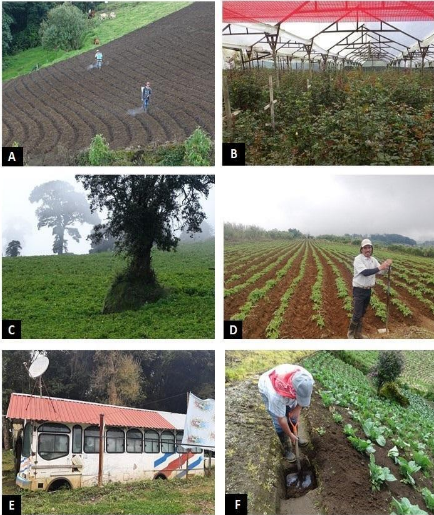
Figura 2. Imágenes representativas de la horticultura de altura y sus dinámicas

Nota: (entre paréntesis: Dimensiones). A: uso de agroquímicos (D1); B: Floricultura en invernaderos. Manejo tecnificado de cultivos (D2); C: bosque residual en cultivo de patatas y descalzamiento con pérdida de suelo por erosión (D3); D: Migrante agroproductor; E: condición de vivienda de obreros migrantes; F: técnicas innovadoras aplicadas a la producción y al manejo del suelo (D4).