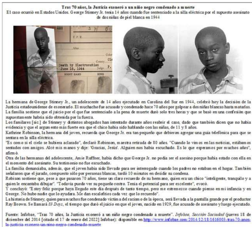
Figura No. 1: El Caso de George Stinney Jr. El niño afroamericano sentenciado y ejecutado en la silla eléctrica en 1944

salvadores del niño reproducían el mismo modo de ver el crimen y la delincuencia que una generación anterior de reformadores. fueron innovadores porque crearon nuevas instituciones y métodos de control social. Las reformas pro salvación del niño eran parte de un movimiento mucho mayor para reajustar las instituciones de modo que satisficieran los requerimientos del sistema emergente de capitalismo corporado. Desde el tumulto de Haymarket (1886), los centros de actividad industrial han sido afectados continuamente por huelgas, interrupciones violentas y muchos fracasos y fluctuaciones en los negocios. (...) El movimiento pro salvación del niño no era una empresa humanitaria en ayuda de la clase obrera y frente al orden establecido. Al contrario, su impulso procedía primordialmente de la clase media y la superior, que contribuyeron a la invención de nuevos [sic.] formas de control social para proteger su poderío y sus privilegios. Este movimiento no fue un fenómeno aislado, sino que reflejaba cambios masivos acontecidos en el modo de producción, desde el dejar-hacer hasta el capitalismo monopolístico, y en la estrategia del control social, de la ineficaz represión a la benevolencia del Estado benefactor". Platt, "Los Salvadores del Niño", pp. 19-21.