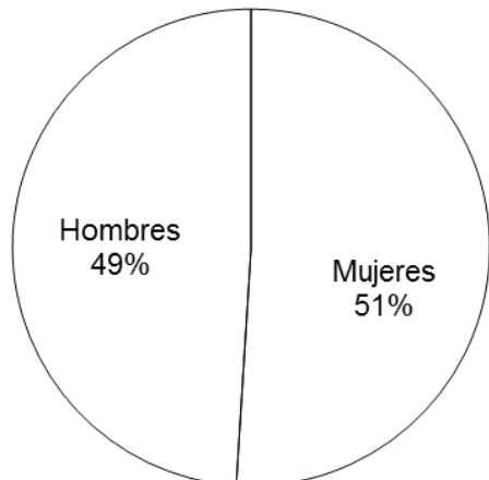
Gráfico 1. Costa Rica. Población Joven de 15 a 35 años, según Sexo. 2013