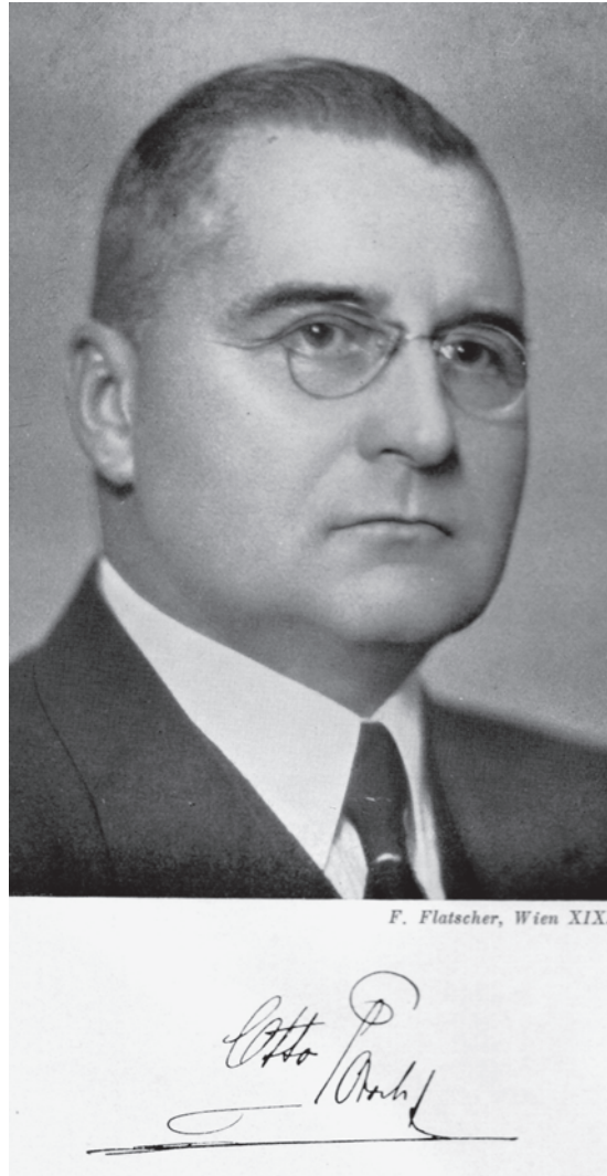
Fig. 1: Dr. Otto Porsch.

Costa Rica, entre ellos el geólogo alemán Karl Sapper (1866-1945) y el botánico estadounidense Phillip Calvert (1871-1961). 5