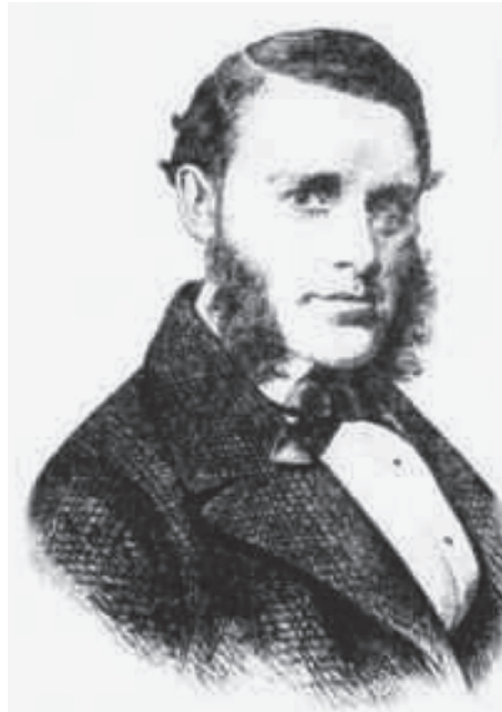
Fig. 2: Karl von Scherzer