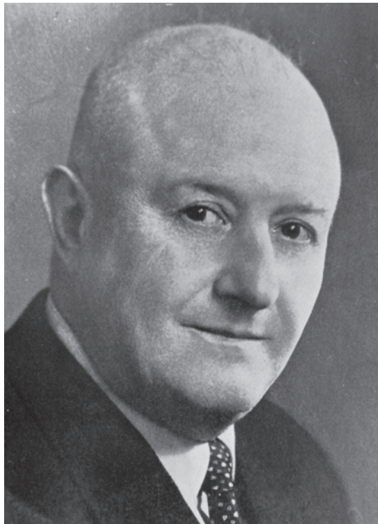
Fig. 3: Georg Cufodontis.

En Costa Rica, la crisis económica generada por esta coyuntura provocó la caída de los precios internacionales del café y del banano, que constituían el grueso de las exportaciones costarricenses al mercado internacional, situación que fue agravada por la contracción experimentada en las importaciones, la devaluación del colón, el agotamiento de la frontera agrícola -que otrora compensaba las crisis mediante la apertura de nuevos frentes de colonización-, el desgaste paulatino de los suelos aptos para la agricultura, la expansión de plagas en las plantaciones y el creciente aumento de la conflictividad social en las áreas rurales y urbanas. 15 Esta situación provocó una mayor intervención del Estado en la economía costarricense y en el ámbito comercial, llevó a la búsqueda de nuevos mercados para colocar la producción cafetalera nacional, por lo que se estudió la posibilidad de aumentar las ventas a otros países, entre ellos Austria, nación que mencionó por primera vez a la república centroamericana como proveedor de café en sus libros de estadísticas comerciales en 1928. 16