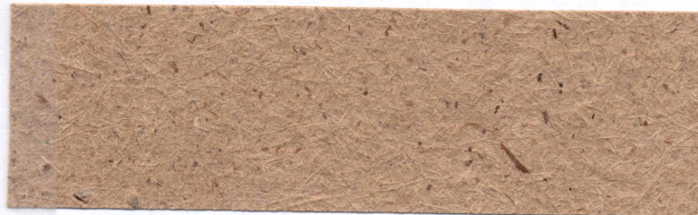
Papel de Ginger ( Zingiber officinale roscoe )