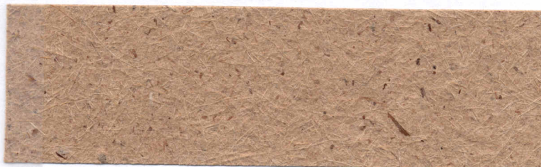
Papel de Ginger ( Zingiber officinale roscoe )