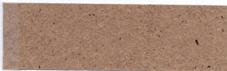
Papel de Guácimo ( Guácimo ulmifolia )