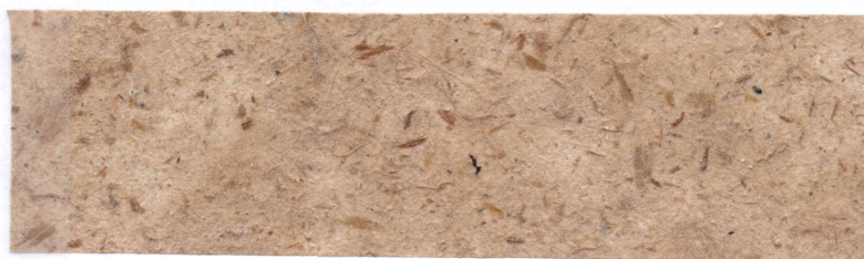
Papel de Fruta de pan ( Artocarpus alfilis )