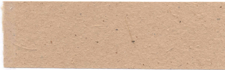
Papel de fluodema de Algodón ( Gossy pium hirsutum )