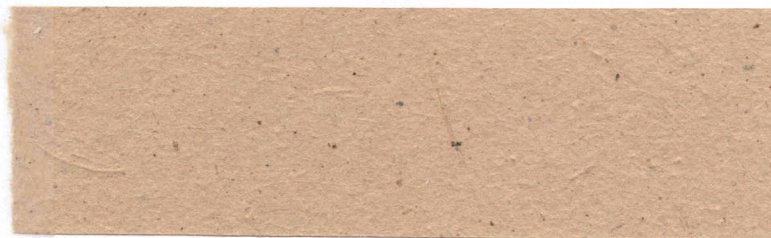
Papel de fluodema de Algodón ( Gossy pium hirsutum )