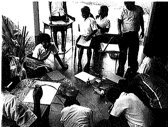
Figura 7. Niños de la escuela de Shiroles participando en el taller.