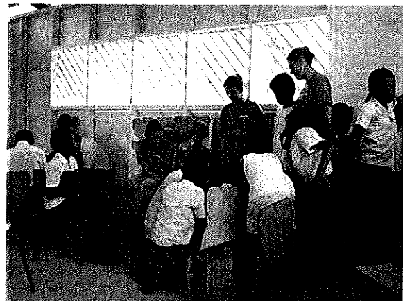
Figura 8. Líderes durante el taller en la escuela de Sepecue.