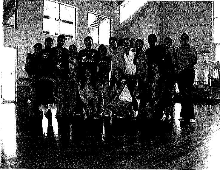
Figura 1. Grupo de líderes durante el Taller "Los guardianes de la creación".

Este subproyecto se ejecuta en coordinación y patrocinio del Colegio de Farmacéuticos de Costa Rica y el Programa de Voluntariado de la Universidad de Costa Rica.