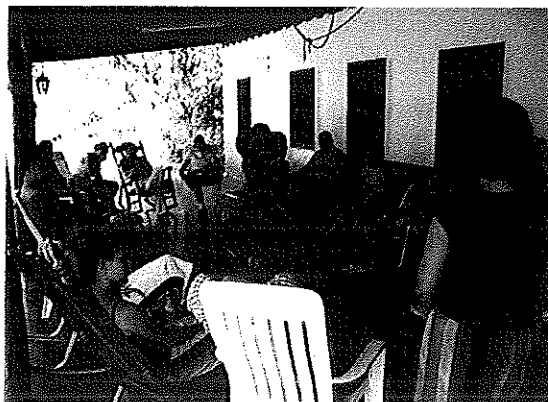
Figura 9. Líderes durante la encerrona de evaluación de las actividades desarrolladas en Talamanca.