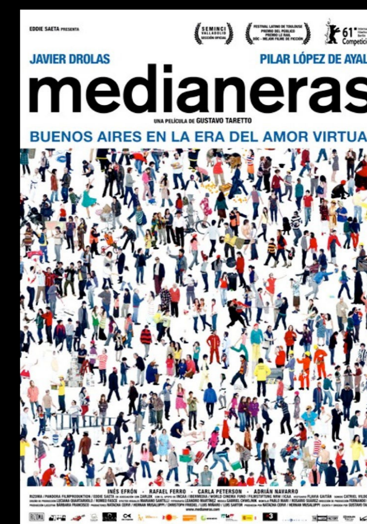
Figura 1. Póster. Taretto, Gustavo. Medianeras , Argentina, 2011

La discontinuidad histórica de los procesos sociales en Latinoamérica, y su impacto en la configuración del territorio y de sus ciudades, han producido ciudades con grandes desigualdades y diferencias en su tejido urbano, desarrollo y arquitectura. Esto se ha expresado de manera relevante en películas del cine latinoamericano como “Medianeras” de Argentina (Fig. 1), “La Zona” y “Amores Perros” de México.