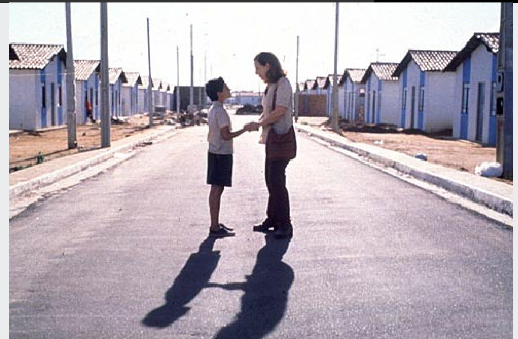
Figura 5. Salles, Walter. Estación Central , Brasil.

esto se muestra en las películas “Estación Central” (Fig. 4 y 5), de Brasil, “La estrategia del caracol” (Fig. 6), de Colombia y “Caribe”, de Costa Rica.