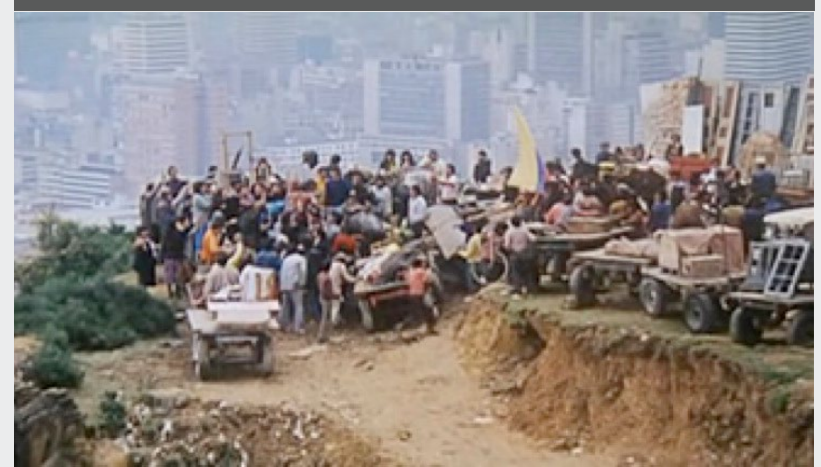
Figura 6. Cabrera, Sergio. La Estrategia del Caracol , Colombia, 1993

Como conclusión, vemos que la imagen de la ciudad Latinoamericana se presenta en sus diferentes formas las películas de la región y con una gran riqueza estética donde se representan tanto el Nuevo Cine Latinoamericano