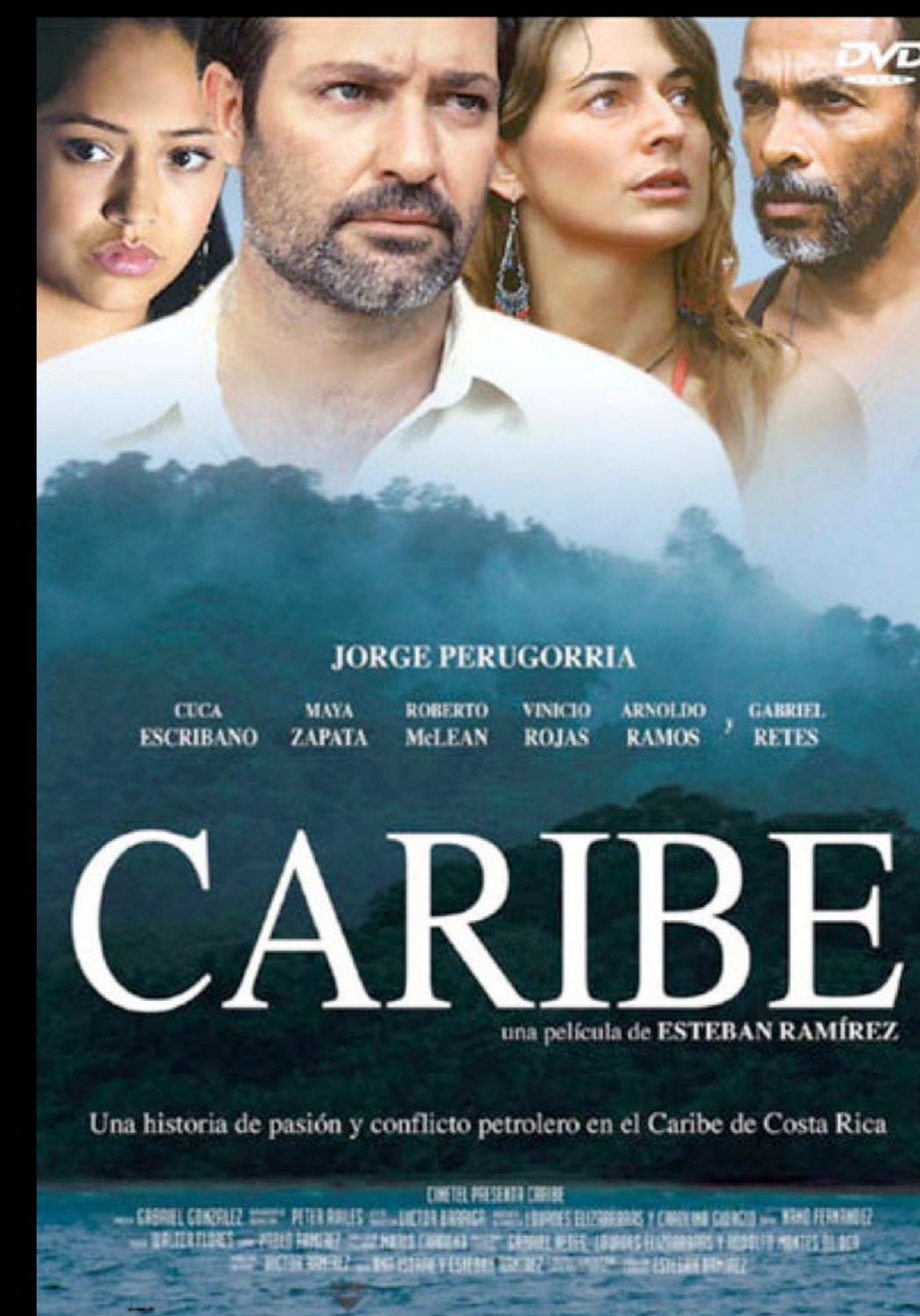
Figura 8. Póster. Ramírez, Esteban. Caribe , Costa Rica, 2004.

como el Cine de la Globalización de América Latina. Con este grupo de películas como ejemplos de manifestaciones de la imágenes de la ciudad latinoamericana en el cine, se concluye que el espacio urbano es fundamental en el discurso del cine de esta región y presenta las diferentes condiciones urbanas con sus fragmentaciones, contradicciones y desigualdades, para ser tomadas en cuenta en un proceso de conciencia ciudadana.