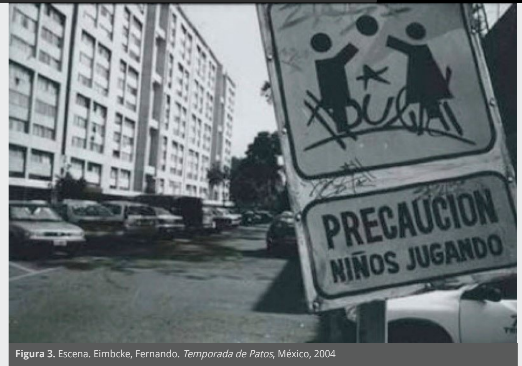
Figura 3. Escena. Eimbcke, Fernando. Temporada de Patos , México, 2004

“Mundo Grúa”, de Argentina, “La ciudad del silencio”, de Estados Unidos, nos muestran imágenes de la ciudad latinoamericana industrializada. La primera nos presenta a la arquitectura como la industria que configura las ciudades modernas en Latinoamérica, como expresión del desarrollo económico