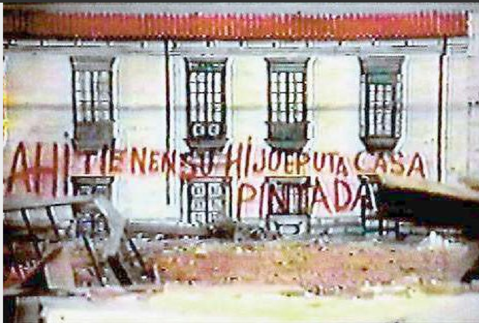
Figura 7. Cabrera, Sergio. La Estrategia del Caracol , Colombia, 1993

como el Cine de la Globalización de América Latina. Con este grupo de películas como ejemplos de manifestaciones de la imágenes de la ciudad latinoamericana en el cine, se concluye que el espacio urbano es fundamental en el discurso del cine de esta región y presenta las diferentes condiciones urbanas con sus fragmentaciones, contradicciones y desigualdades, para ser tomadas en cuenta en un proceso de conciencia ciudadana.