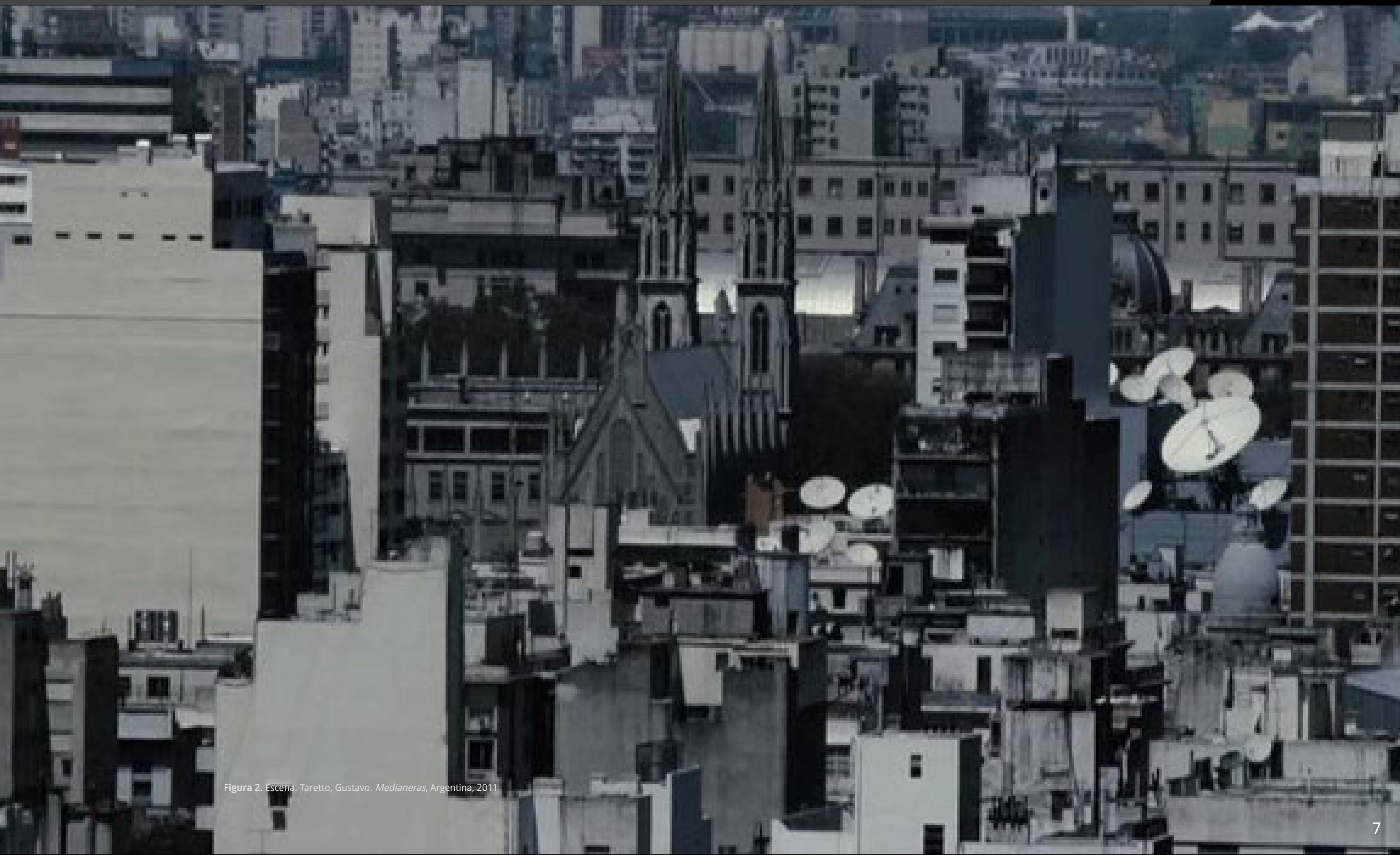
Figura 2. Escena. Taretto, Gustavo. Medianeras , Argentina, 2011