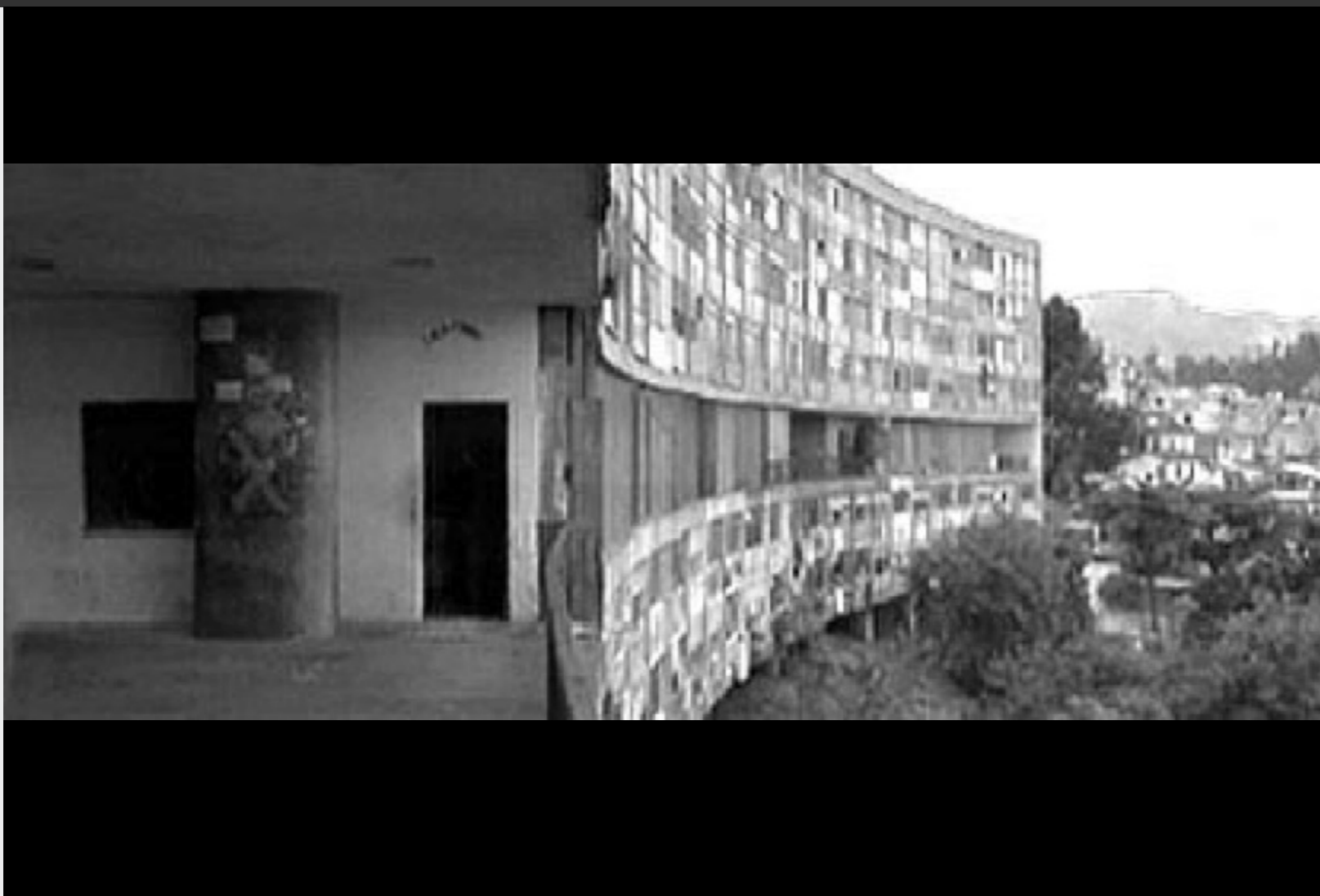
Figura 4. Salles, Walter. Estación Central , Brasil.